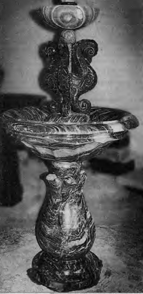
Почти двухметровая ваза-фонтан.

— Автор проекта Александр Дербнев, а исполня-