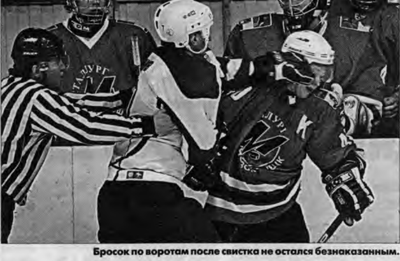
Бросок по воротам после свистка не остался безнаказанным.

В полуфинале одной из команд надо одержать три победы. Если «Металлург-2» дома дважды выиграет и сравняет счет в серии, то пятый, решающий матч состоится в Барнауле 15 февраля.