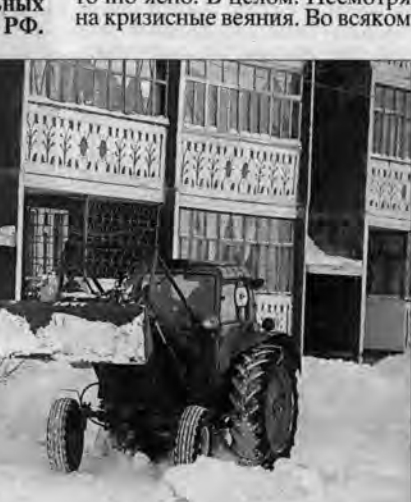
власть инициативно проводит информационную работу среди жителей, — добавил он.

— Реформа лучше всего идет там, где региональная и в первую очередь муниципальная