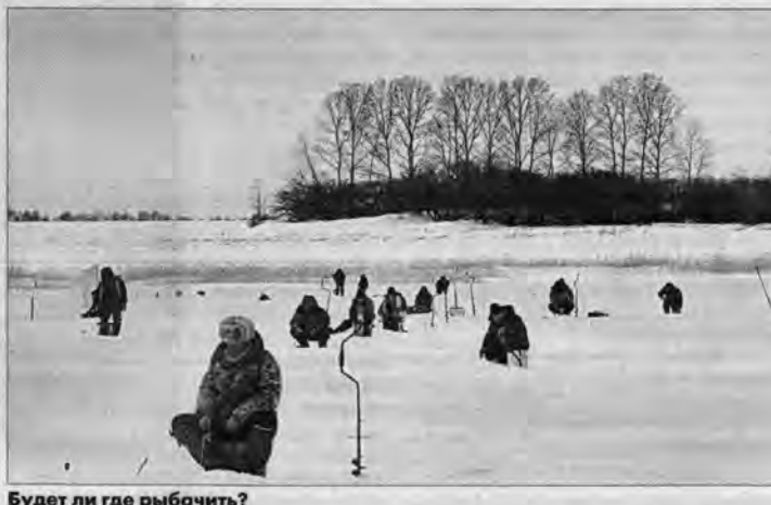
Будет ли где рыбачить?

Еще в начале 30-х годов прошлого века наши деды подметили нужду в сооружении этой дамбы на русле речки Бурды. Они на быках, запряженных в телеги, возили грунт в указанное место. Работа проводилась не на глазок: плотина росла по проекту, разработанному специалистами "Ленводпронза". Однако вскоре ее провало в месте сопряжения с донным выпуском, питавшим водой пруды, расположенные ниже рыбоводника. Тогда плотина называлась Зудиловской — по поселку.