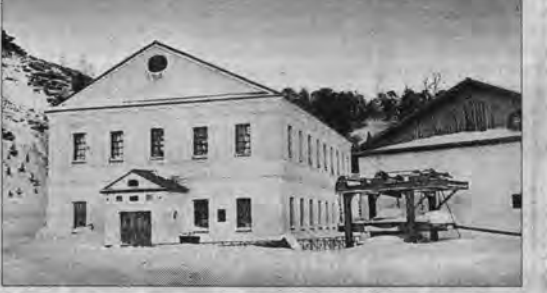
С этого корпуса начиналась Колывань камерная.