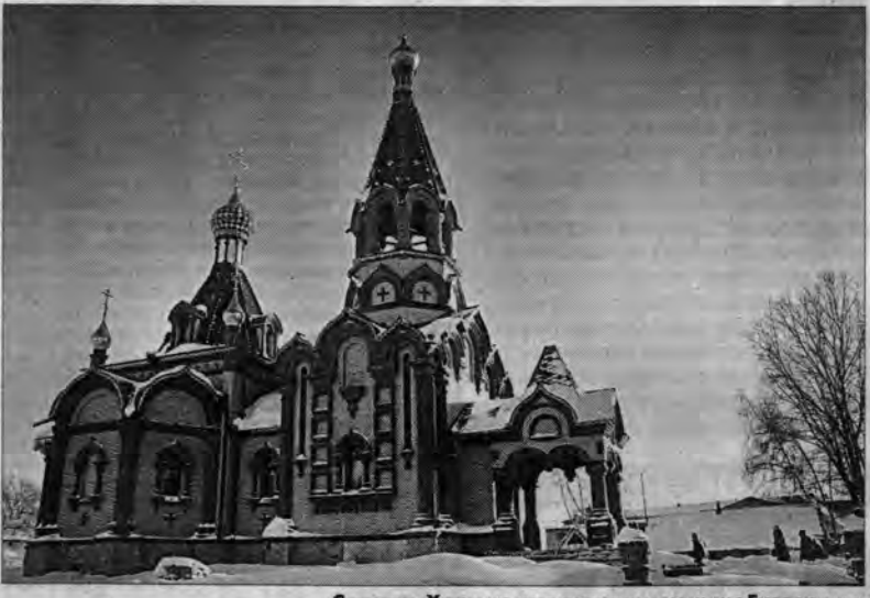
Сrostки. Храм во имя великомученицы Екатерины.

Мы уже рассказывали о строительстве нового фондохранилища музея Василия Макаровича, о переоборудованной и обновленной библиотеке, о крупномасштабном ремонте школы, носящей имя знаменитого земляка. Но, пожалуй, для свежего взгляда самая заметная из новостроек в селе - сказочно красивая церковь во имя великомученицы Екатерины.