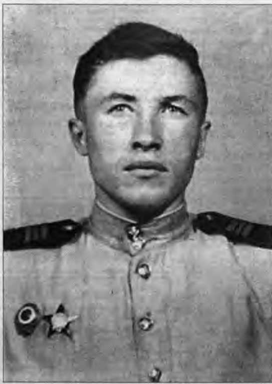
Снимок военных лет.