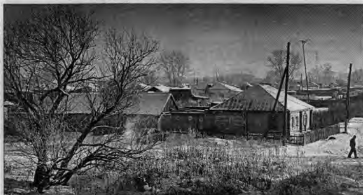
Село Новоегорьевское стало для ветерана родным.