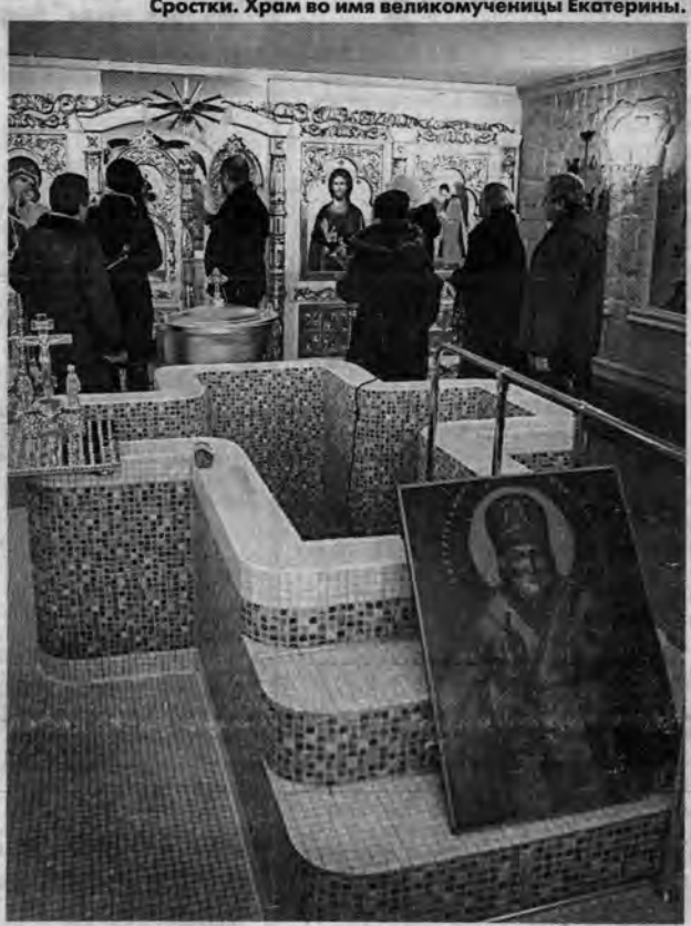
В нижнем храме (крестильня).