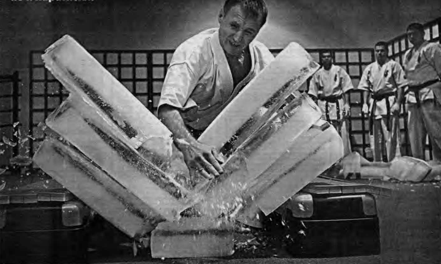
Одним ударом! А каждая глыба весит около тридцати килограммов!

В Барнауле ледовое шоу могут показывать не только фигуристы, но и каратисты!