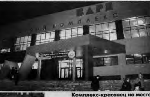
Комплекс-красавец на месте развалин.