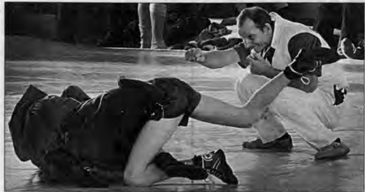
Судья все видит.

В минувшие выходные в Барнауле состоялся краевой турнир по самбо памяти одного из основоположников этой борьбы на Алтае заслуженного тренера России Виктора Репина.