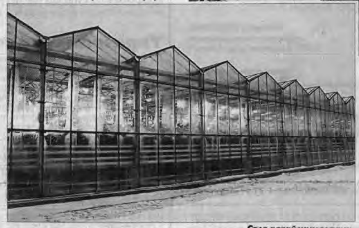
Свет алтайских теплиц.

СПРАВКА "АП". АКТУП "Индустиальный" занимается выращиванием и переработкой овощей, выращиванием семян и рассадой, торговлей овощной продукцией. Тепличный комплекс составляет 24 га (площадь защищенного грунта). На предприятии работает свыше 730 человек. Размер средней заработной платы в 2008 г. составил около двенадцати тысяч рублей. В 2008 году на предприятии собрано 7,2 тыс. тонн овощей. На развитие производства АКТУП "Индустиальный" в 2008 году направлено 181 млн. рублей, из них собственных средств - 81 млн. рублей.