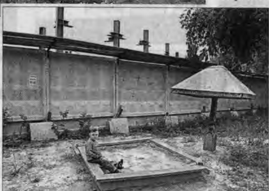
На стройплощадке в эти дни появились плиты... производственные шумы, работал кран.