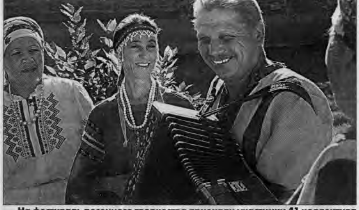
На фестиваль песенного творчества приехали участники 41 коллектива из Алтайского края, Кемерово, Новосибирска и Козьмодовского.