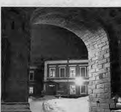
Музей истории литературы и культуры Алтай. Та самая дворцовая усадьба.

В Барнауле прошел бал-маскарад в традициях XIX века