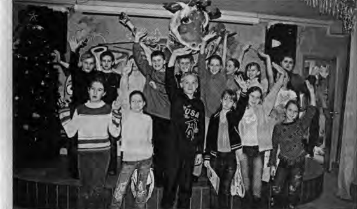
Испытания игры "Школа, вперед!" понравились всем.

В Барнауле проведена уникальная игра для школьников 5-7 классов "Школа, вперед!"