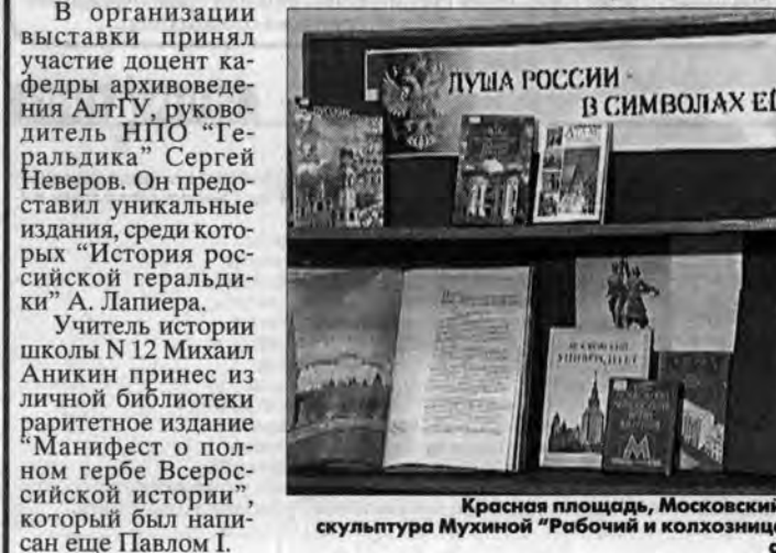
Красная площадь, Московский метрополитен, скульптура Мухомой "Рабочий и колхозница" - все это тоже символы России.

В краевой библиотеке им. В.Шшкова открылась выставка "Россия в символах". Здесь представлено более 600 изданий, раскрывающих историю нашей страны через государственную и военную символику.