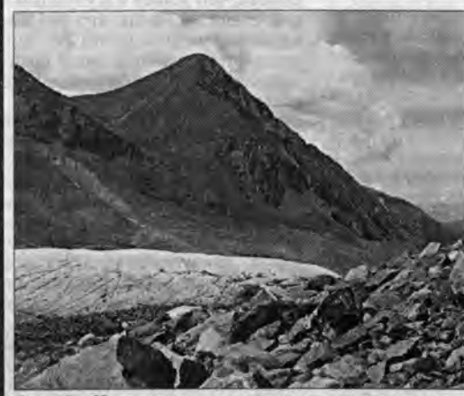
Язык Ак-Кемского ледника, по словам туристов, бывавших здесь лет десять назад, стал короче на несколько километров.

Почему организм - уставший, промокший и к тому же голодный - так хорошо себя здесь чувствует? Из-за неведомой энергетики Белухи, о которой столько разговоров и легенд? Или все дело в неосвоенности природы? Пришел к выводу, что причина и в том, и в другом. Правда, чудотворную энергетику надо еще научно зафиксировать и объяснить. Зато почувствовать разницу экологического состояния природы можно без всяких приборов, достаточно собственных глаз, обоняния и других органов чувств, данных человеку для общения с окружающим миром.