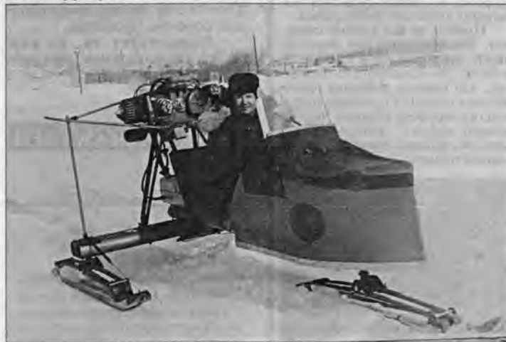
Одна из первых моделей универсального снаряда.

Первые аэросани, сооруженные почти четверть века назад, были открытыми. В степи, на морозе ездовых проминало до костей. Но изобретателю холод был ничем. Его грело чувство удовлетворения, что наконец-то удалось воплотить детскую мечту. Кое-какие агрегаты были еще "сырыми", но главное - аэросани передвигались, удивляя ошалевших случайных свидетелей. Он довел первенца до кондиции и продал в 1982 году, чтобы срочно заняться новой моделью. Эта была мощнее, совершеннее, с полузакрытой кабиной. В 1984 году рискнул предложить к публикации в журнале "Моделист-конструктор" чертежи и описание своего детища. Его завалили письмами со всего Советского Союза. Сначала послания хранились в папках, потом пришлось приобретать мешки. Ин-