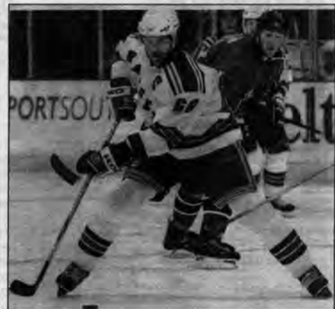
Знаменитый форвард не просто играет, но и зарабатывает огромные деньги.

В девяностых Пушкаша, конечно же, реабилитировали, вернули ему все титулы и почести. В его честь даже переименовали стадион в Будапеште. А в 1993 году он в качестве главного тренера сборной Венгрии приехал в Россию. В страну, которая так уважала на его карьеру.