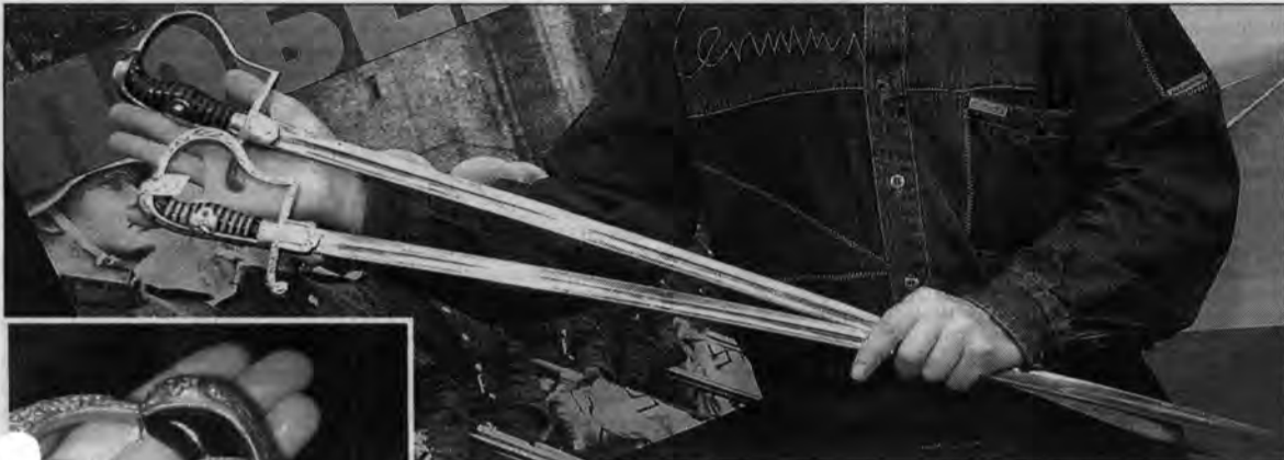
Сабли и эфес парадной сабли для немецких офицеров – с ними командиры вермахта собирались пройти торжественным маршем по Красной площади. Сабли были найдены в обзоре после разгрома немцев и привезены в Барнаул одним из бойцов как трофеем. Переданы в военно-исторический отдел потомками солдата.