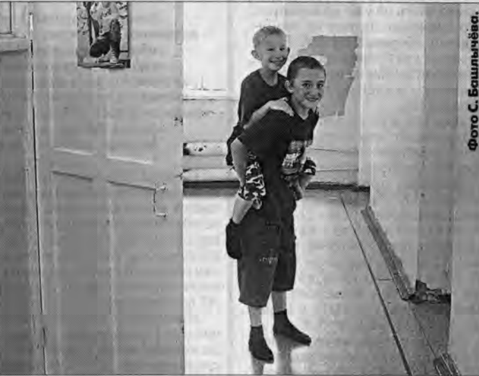
Ты отговори, брат, не шей, Твои известны выкрутасы. Уж больно играем мы в рикшей, Вперед, на волошку, в пампасы! Не сомневайся, милый друг, Тебе ничто не угрожает. Не вИноват я, что вокруг Бензин так быстро дорожает.

Какой же читатель не любит призы? Скорее всего, таких нет. Особенно приятно заработать приз, бесуев интеллектом. Представляем такую возможность. Задача простая. В нескольких номерах "АП" мы будем публиковать под рубрикой "Не зевай!" фотографии и ироничные стихотворные подписи к ним. Некоторые буквы и знаки препинания будут выделены жирным шрифтом. Сложив их последовательно одну за другой, вы получите крылатое выражение. Первые десять читателей, приславших его, получат небольшие призы.