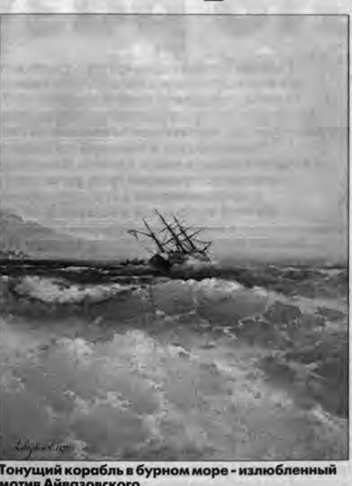
Тонущий корабль в бурном море - излюбленный мотив Айвазовского.

Помимо Айвазовского, на выставке представлены другие художники-маринисты: Михаил Клодт, Алексей Боголюбов, Томас Рубенс. Работники музея включили в экспозицию пять моделей кораблей: от старинного фрегата до буксира. Модели