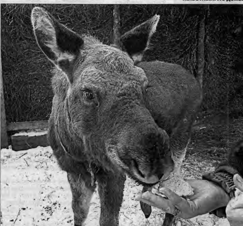
Теперь лесных великанов у села Лосиха не будет?