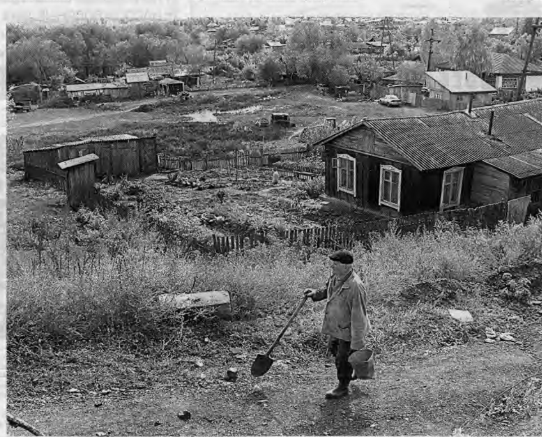
Еще немного поработаем...

В саду перед массовым листопадом необходимо провести осенний влагозарядный полив плодовых и ягодных культур, особенно поздней осенью в сухую осень и после больших урожаев. В начале октября необходимо внести в почву органические и минеральные удобрения. Удобрения можно разбросать в сухом виде перед поливом. Опавшие листья лучше стрести и закопировать. Старые, отмирающие и погибшие деревья выкопать, почву хорошо удобрить, глубоко перекопать и два-четыре года использовать под другие культуры. Так постепенно подготавливается место для посадки плодовых саженцев.