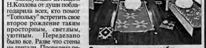
Одежда и подушки ждут ребят.