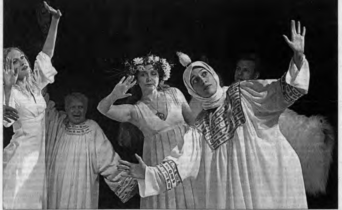
В спектакле двадцать восемь музыкальных номеров.