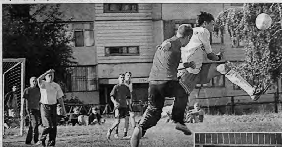
Футбольные танцы на стадионе школы №117.