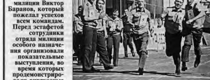
Тяжело... И почему только бег называют легкой атлетикой?