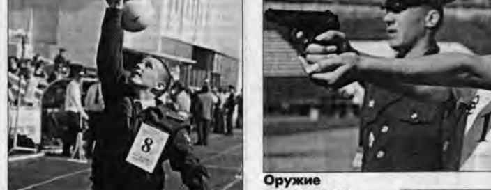
24-килограммовые гири милиционеры поднимали шуто.