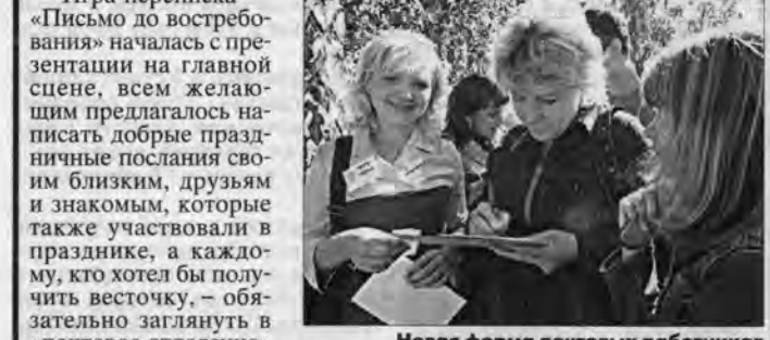
Новая форма почтовых работников — девушкам к лицу.