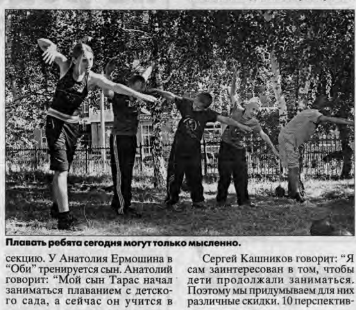
В это время дети тренируются возле спорткомплекса, обязательный элемент ежедневных тренировок - часовые пробежки.