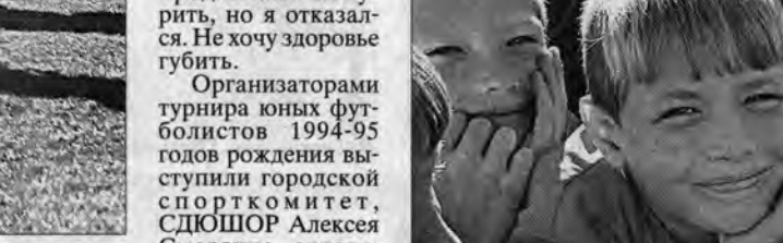
Эти мальчишки из барнаульской команды "Локо-ВРЗ" ловят кайф от футбола, а не от наркотиков.

Третье место занял "Полимер", который по пенальти обыграл футболистов "Ворсинца".