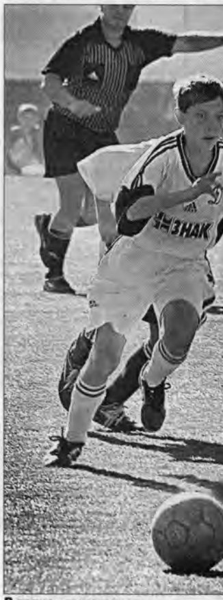
В атаке - динамовцы.

По словам того же Соловichenко, в крае 47,6 процента наркоманов - дети от 11 до 16 лет.