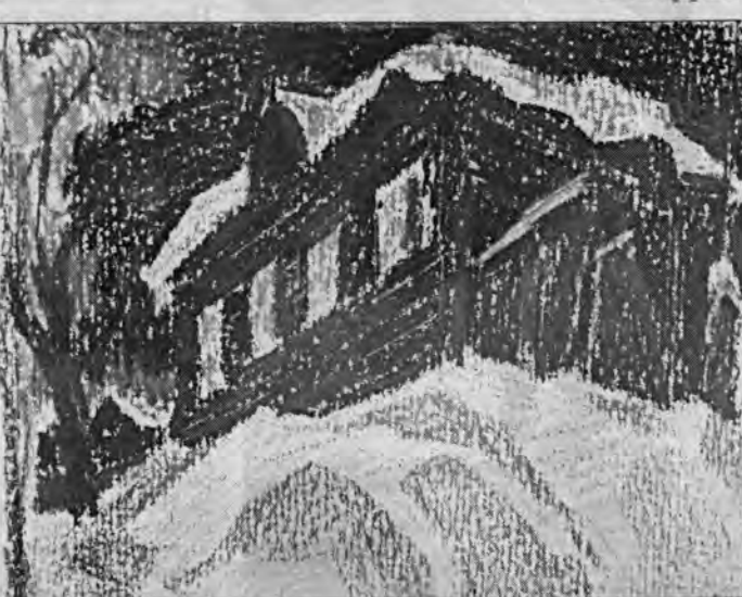
Л.Цесюлевич. "Дом на Никитина. Барнаул".

фиолетовых тонах, а "Мороз" показан через людей, пьющих чай за столом. Как говорит сам художник: "Барнаул - это не только архитектура, но и люди".