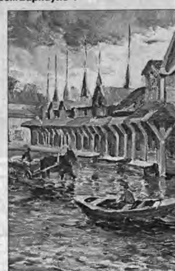
М.Будкев. "Большая вода".

был признан одним из лучших городов России по планировке. Мне бы хотелось уловить настроение того времени". Поэтому в картинах Конькова встречаются