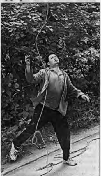
Лесоруб пычется набросить на ветку тополя лассо. По замыслу, потянув за веревку, удасться придать дереву нужное направление падения.

Народ ожидал, что приедет кран или МТС с вышкой, но к месту событий подъехал грузовик из ЖЭУ, с помощью которого лесорубы намеревались тянуть дерево в нужном направлении.