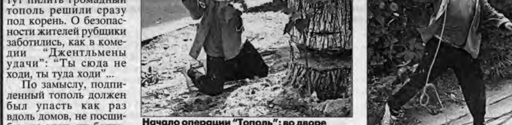
Начало операции "Тополь": во дворе раздавался топор дровосека.