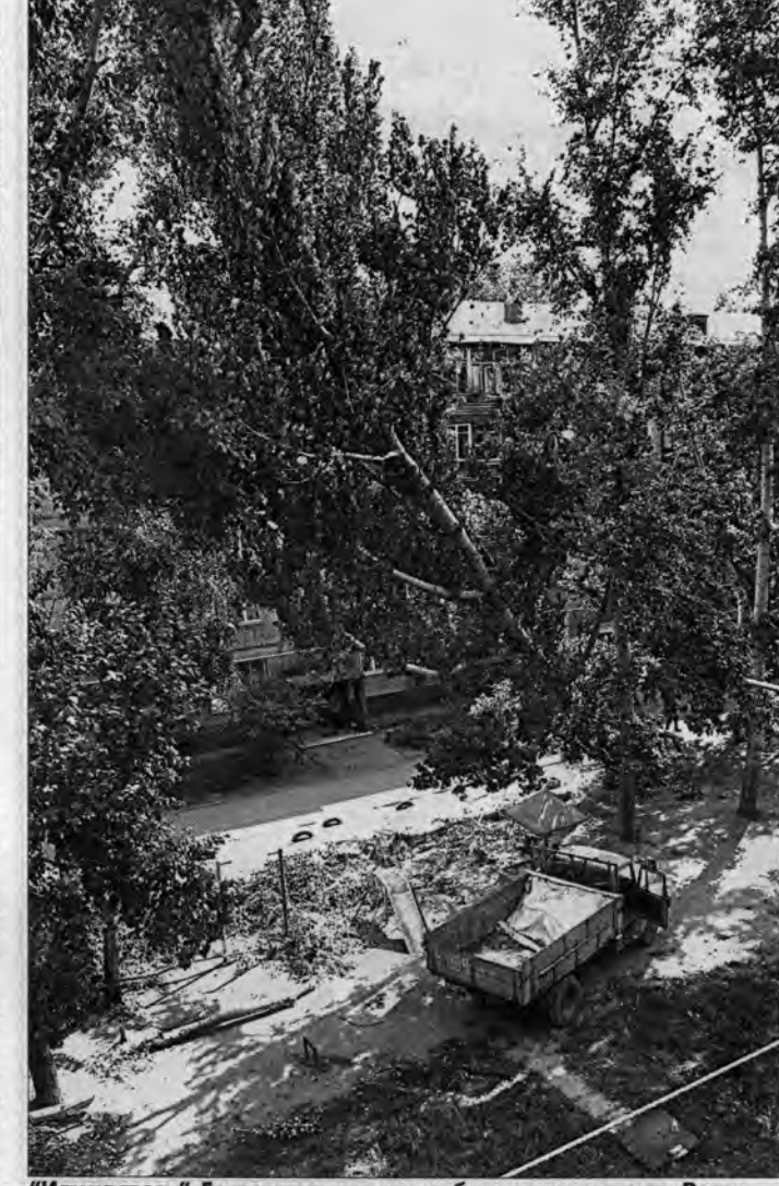
"Иду на грозу". Грузовик опасно приближается к тополю. Водитель открыл все двери, чтобы успеть выскочить.

Один из свидетелей этой истории нам рассказал: "И тут старый тополь затрещал, качнулся в сторону дома N 203 и замер. Кое-кто начал потихоньку перетаскивать с балконов банки с соленьями и закрывать животнох подальше в квартиру. Лесорубы запанико-