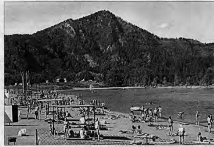
«Бирюзовая Катунь» — перспективный туристический комплекс.