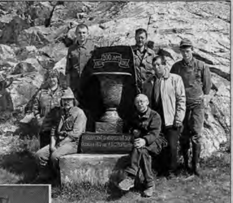
Новое поколение камнерезов.