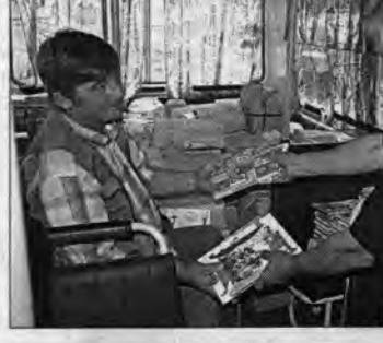
Каждый день с краевого склада получают учебники несколько районов. Эти книги уехали в Егорьевский район.