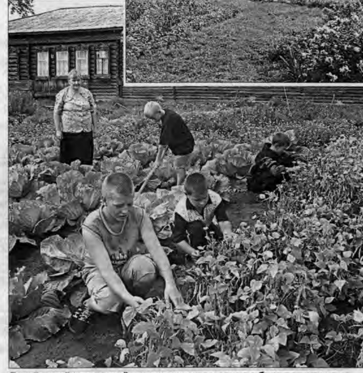
Дети в этой маленькой школе воспитывают в глубоком уважении к любому труду - и за партой, и на грядках.

Губернатор говорил, например, о системе профессионального образования края, которая не соотносится с рынком труда, не дает молодым людям те специальности, которые обеспечили бы их хотя бы на старте. Начальное профобразование, заметил он, нередко выполняет лишь социальную функцию: мы помещаем подростка в училище, чтобы он был здесь пристроен, накормлен и одет. На самом деле система НПО призвана готовить специалистов, которых требует сегодня и потребует завтра экономика края, - а в ней происходит явные подвижки.