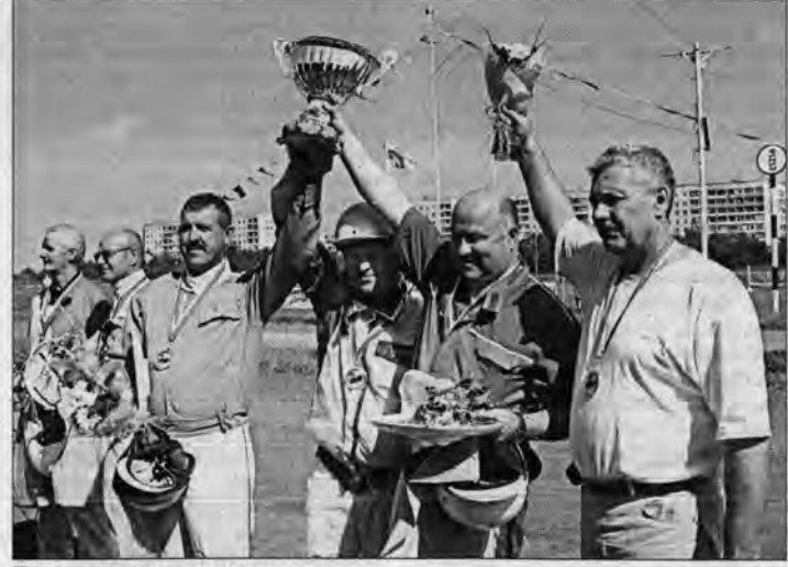
Первое место у россиянина.

Во втором гите, согласно правилам матча, наездник, занявший первое место, выступает на лошади, пришедшей последней; занявший второе место - на предпоследней, и так далее. Таким образом спортсмены имеют возможность полнее раскрыть свое мастерство наездника. Чемпион определен по наименьшей сумме мест в двух гитах. Видимо, финны постепенно освоились и в следующем заезде выступили более уверенно.