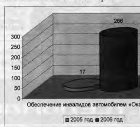
Обеспечение инвалидов автомобилями «Ока»

— Если далее продолжать сравнение, то у меня такое впечатление, что поднажали, толкнули плечом, и машина дрогнула, началось движение вперед. И хотя у многих может возникнуть ощущение, что победа близка — это не так. Яма слишком велика. Если остановиться, расслабиться, то машина откатится назад. Я опасаясь того, что мы слишком рано решим: проблемы позади. Плюс 4,2 процента роста в промышленности — это не минус 8,2, как было в прошлом году, но и не плюс 14. Поэтому расслабляться рано. Кроме того, я верю и в то, что помощь из федерального центра будет оказываться, главное — самим не ослаблять напор.