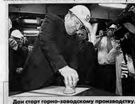
Дан старт горно-заводскому производству.

Вместе с тем была и остается проблема существования теневой экономики. В ней есть все: и ресурсы, в том числе человеческие, и готовая продукция. Но нет того, что любая экономика должна давать обществу, — налоговых поступлений. Теневые доходы становились еще и питательной средой для преступной деятельности и коррумпирования власти. Поэтому проблема так трудно решается. Администрация края принимает меры по выводу экономики «из тени», но они не так эффективны.