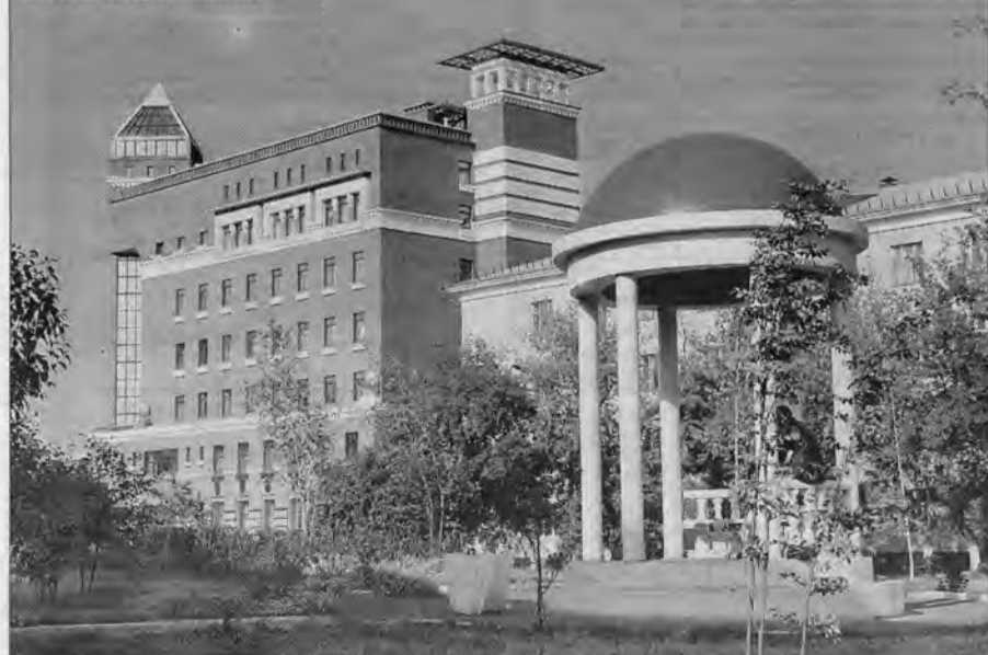
Есть на что посмотреть и где отдохнуть.

Реклама "АП" ул. Короленко, 105, 5 этаж, 501 каб. Тел. 63-34-78, факс 63-44-30