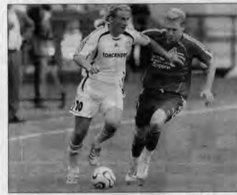
Матч «Локомотив» - «Томь», несмотря на нулевую ничью, получился боевым.

Тем временем московский «Спартак» и «Ростов» выдали щедрый на голы матч - 5:2. Скромнее сыграли московский «Локомотив» и пермский «Амкар» (0:0), «Москва» и «Томь» (0:0), «Спартак» из Нальчика и «Крылья Советов» из Самары (1:1). Трудной победы аутсайдером добился питерский «Зенит». Команда из города на Неве под ру-