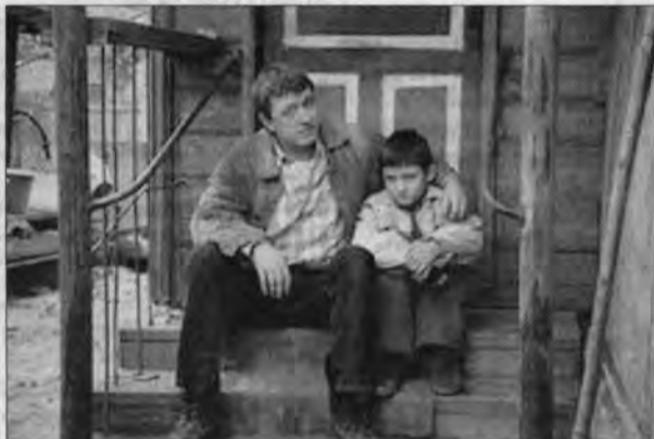
На снимках: кадры из фильма «Коктебель».