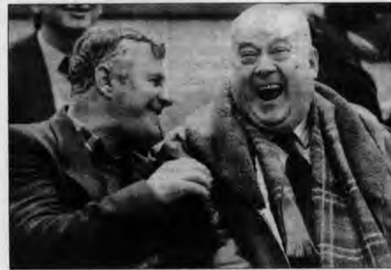
Слава Метревели актеру Евгению Моргунову(справа): «А вот еще один анекдот про Метревели».

ИСТОРИЯ ПЕРВАЯ. Его имя попало в народный фольклор - высшая форма популярности. Кто не знает анекдот про Метревели?