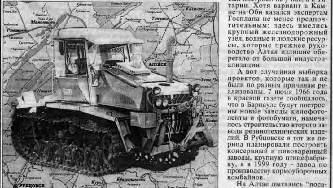
Алтайский трактор Т-250.

В 1822 году село Белоглазово (ныне в Шипуновском районе) переименовали в город Чарыш и возвели в степень окружного, Чарышского центра. Но уже через пять лет, в 1827 году, город Чарыш вновь был обращен в село Белоглазово. А окружным центром Томской губернии опять стал Бийск. Позже также случалось или