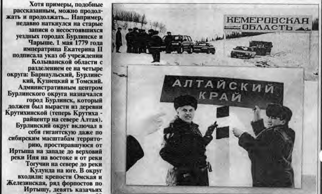
Дорога Алтай - Кузбасс пущена!

В 1822 году село Белоглазово (ныне в Шипуновском районе) переименовали в город Чарыш и возвели в степень окружного, Чарышского центра. Но уже через пять лет, в 1827 году, город Чарыш вновь был обращен в село Белоглазово. А окружным центром Томской губернии опять стал Бийск. Позже также случалось или