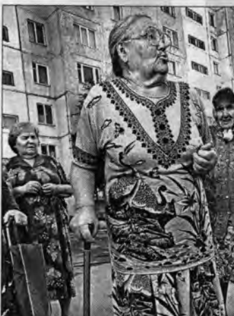
Поход в больницу для пожилых жителей дома N 171 по улице Гушина - это подвиг.

Они живут в доме N 171 по улице Гушина. Многие из жильцов - ветераны войны и тыла. Неудивительно, что у стариков уже давно существуют проблемы со здоровьем. Однако с недавних пор их обычный поход в поликлинику можно приравнять к подвигу.