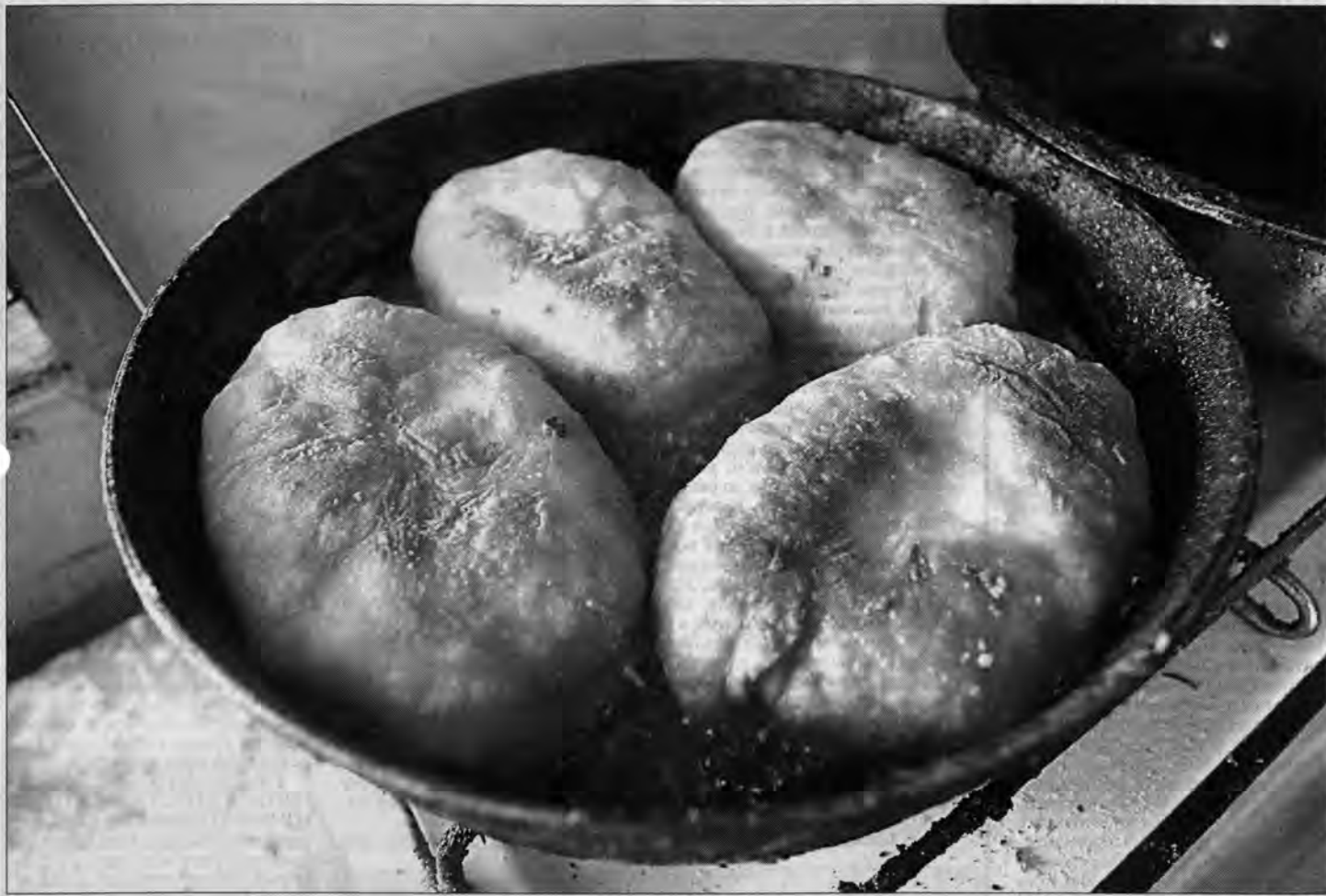
Знаменитые сrostинские пирожки.

Корреспонденты "АП" с огромным удовольствием раскусили тайну сrostинской стряпни