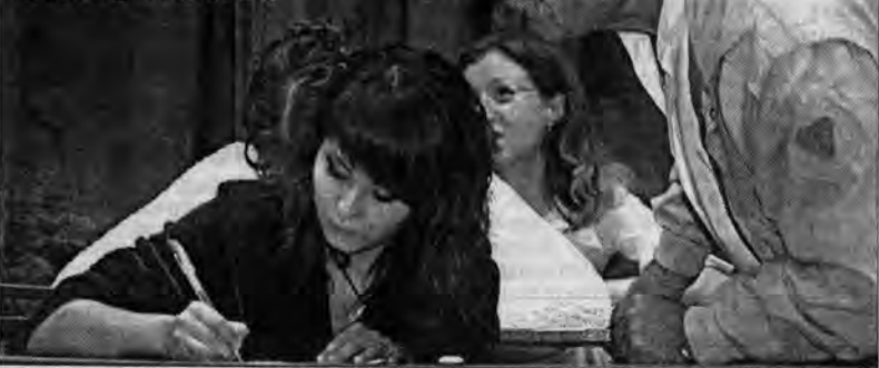
Не подсказывайте, профессор!