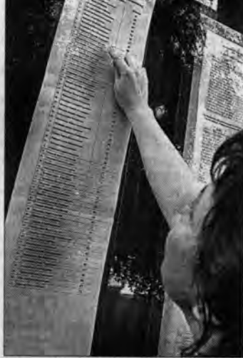
Списки, в которых указано количество набранных баллов, вызывают постоянный интерес.