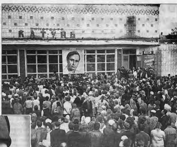
Сростки, кинотеатр "Катунь". 25 июля 1976 года.

Смотрю на фотографии из своего архива и не устаю восхищаться