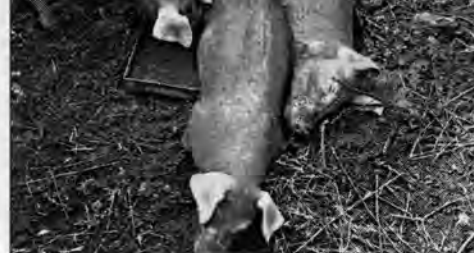
Свиньи породы ландрас.