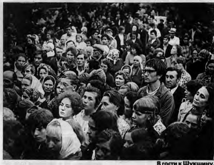
В гости к Шукшину.

врагов. Как не согласиться с актером Георгием Бурковым, который написал в своих воспоминаниях о подлинной многолетней дружбе вплоть до последнего дня жизни Шукшина: "Васю закрутили, завертели в партийном хороводе, и легионы корреспондентов разорвали его сердце в клочья. Ему, Васе, казалось, что он - гениальный стратег. Ради Степана Разина, ради того, чтобы осуществить цель своей жизни, свое предназначение, он терпел всю эту обнищавшую свору духовных пастырей, кормил их уже одним тем, что позволял дойти себя. Ему казалось, что он хитрит и обманывает их. Получилось наоборот, его обманули. Они-то уж знали, что делали и делают..." (Из книги "Граф Монте-Кристо по-русски").