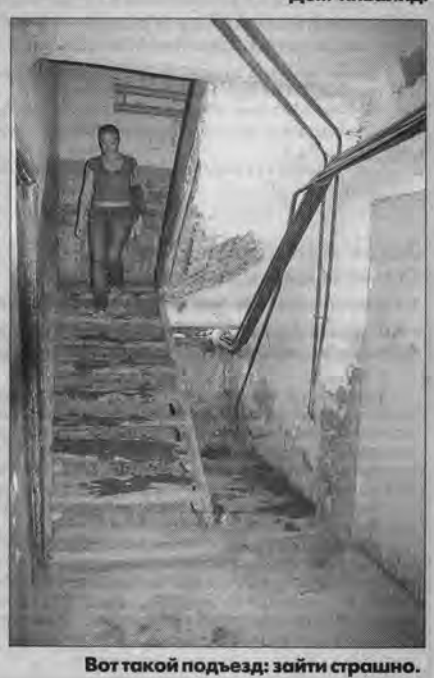
Вот такой подъезд: зойти страшно.