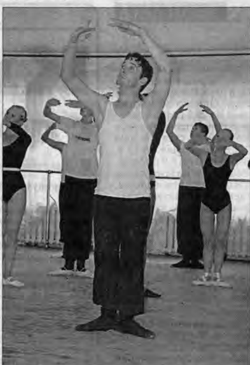
По некоторым абитуриентам АГАКИ "плачет" Большой театр.

В вузах края начались вступительные экзамены. Наши корреспонденты посмотрели, как это делается в Алтайской академии культуры и искусства (АГАКИ)