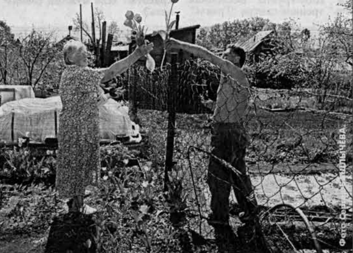
Лето. Время дарить цветы.

В первой декаде июля можно готовить грядки под землянику.