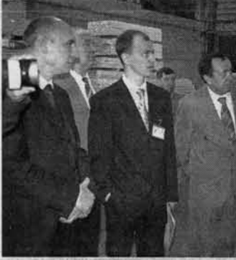
Экскурсия по заводу. Гостям показали всю технологическую цепочку, по которой проходит пиломатериал.

Гостям показали весь рабочий цикл, по которому проходит переработка древесины: от распиловки сырья до упаковки готовой продукции.