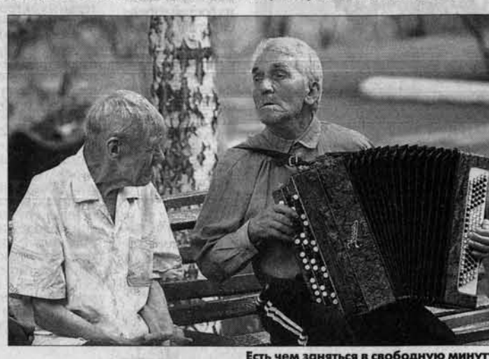
Есть чем заняться в свободную минуту.

на. Думали обосноваться у сына, но он вскоре умер. И ушли старики в дом-интернат. Сноха, правда, не забывает их, навещает. Бывает, и они к ней в гости навещаются.