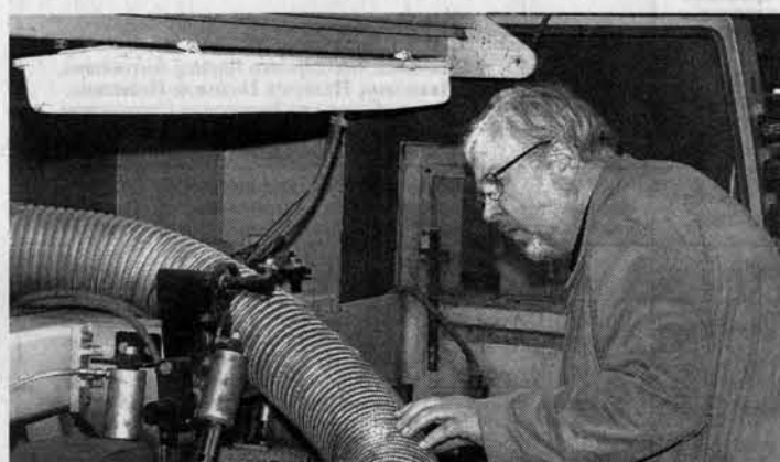
Главный эксперт Европейского банка реконструкции и развития Э. Пасиса: «Я был удивлен, что такую качественную продукцию будут производить в Сибири».

ными предприятиями будущее в этой отрасли и им нужно всячески помогать. Эта линия высокотехнологична и универсальна, - сказал он. - Немецкое оборудование позволяет выпускать качественную продукцию, она конкурентна по цене, поскольку пакет заказов сформирован под стопроцентную производительность предприятия.