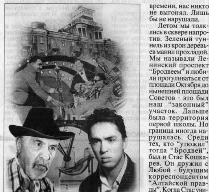
Коллаж из книги А. Александрова "Чуваки, не унывайте!"

ульская молодежь обычно называла под большими круглыми часами над входом в клуб БМК. Там же стояла будочка таксофона. Иногда случались и драки. Но редко. Как-то на наших глазах Глеб, по прозвищу Резаный, в момент раскидал сразу трех человек, напавших на него с ножом. Этот Глеб был знаменит еще и тем, что на спор прыгнул в "ковши" с подвесного моста у элеватора.