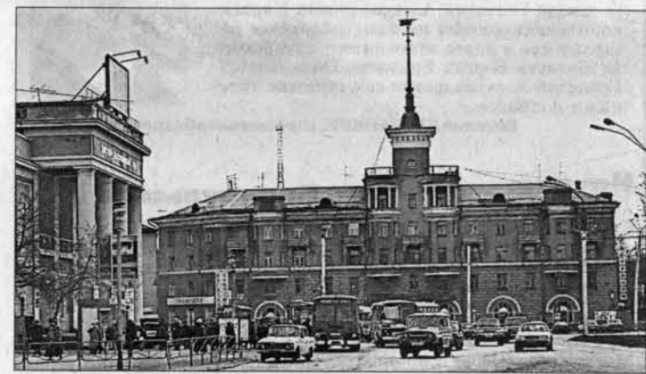
80-е годы. Часов под шпилем ещё нет.