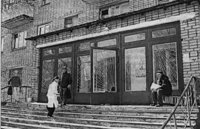
Поликлиника N 7 размещалась в одной из пятиэтажек микрорайона.