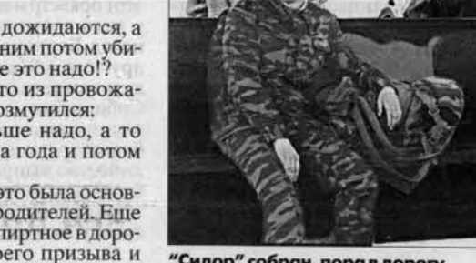
"Сидор" собран, пора в дорогу.

Чаще писать - это была основная просьба всех родителей. Еще просили не пить спиртное в дороге, держаться своего призыва и