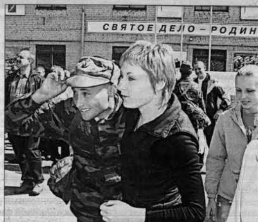
Что там, за горизонтом?