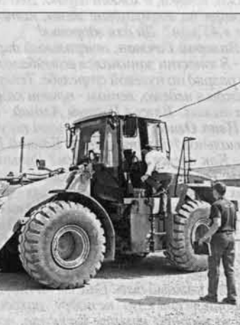
"На старт, марш!"

Девочка, у которой умерла мама, не захотела играть с детьми только по той причине, что у них отцы никчужные. "Даже гроба не могут сделать". Это было два года назад. Девочку тут отогрели за это время, затопили во всевозможные кружки, она теперь рисует и пляшет в ансамбле, и на вопрос психолога: "Что такое золотые руки?" - привела в пример отца, который плетет замечательные корзины.