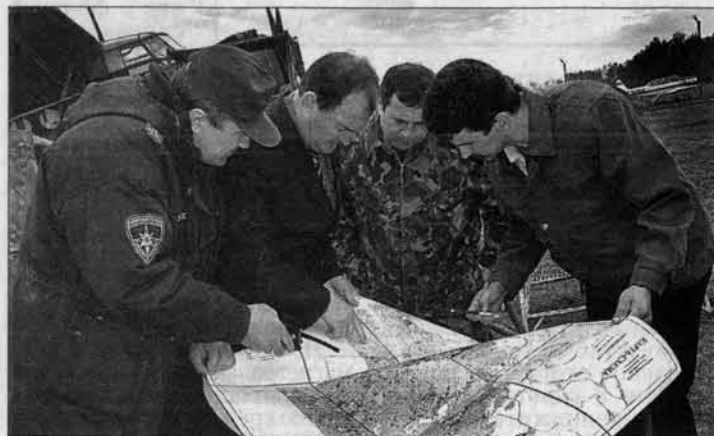
Последнее уточнение маршрута.