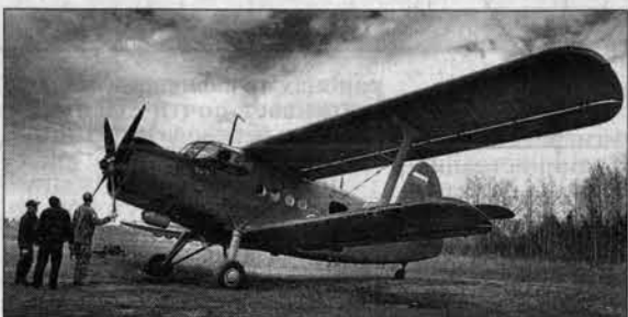
Через пять минут - в полет.

жара мы определяли визуально с помощью карты. Сейчас же используем компьютер, благодаря специальной программе мы получили возможность устанавливать, в каком квартале очаг, - с точностью до 10-15 метров. Еще одно преимущество использования компьютерной техники - быстрота, теперь не надо долго кружить над пожарищем.