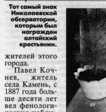
Тот самый знак Николаевский, которым был награжден алтайский крестьянин.