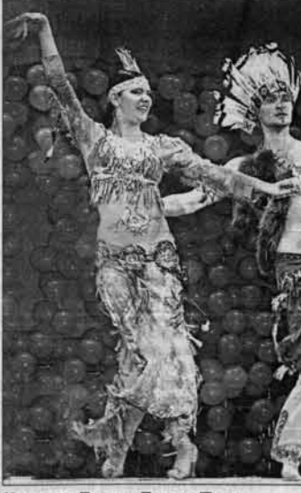
Нежная Лань и Белое Перо.