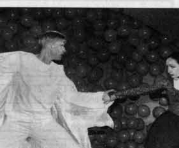
Кого выбрать? Ангел - хорош, но Бес...