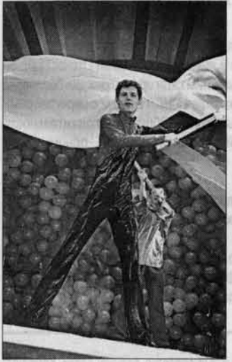
Вед под знамена танца Фрагмент открытия гала-концерта.

Три дня шли финальные концерты в Барнауле, и все эти дни стали для поклонников танца подлинным праздником. Вот членам жюри пришлось туго: только в заключительном туре соревновались не меньше тридцати лучших коллективов края: те, что стали победителями отборочных туров. Общее же количество просмотренных жюри номеров подсчитать трудно. Дело в том, что по условиям конкурса один и тот же коллектив мог представить классический и народный, балльный и эстрадный танец. В краевом фести-