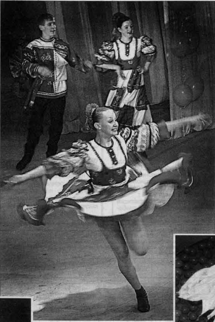
На сцене - "Иван-да-Марья": танец "Вечерком-вечерком".

Три дня шли финальные концерты в Барнауле, и все эти дни стали для поклонников танца подлинным праздником. Вот членам жюри пришлось туго: только в заключительном туре соревновались не меньше тридцати лучших коллективов края: те, что стали победителями отборочных туров. Общее же количество просмотренных жюри номеров подсчитать трудно. Дело в том, что по условиям конкурса один и тот же коллектив мог представить классический и народный, балльный и эстрадный танец. В краевом фести-