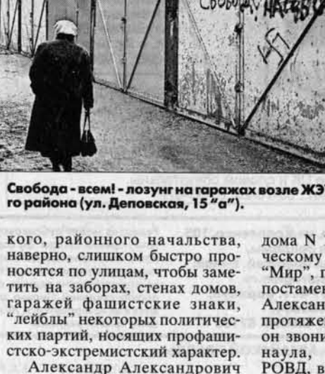
Свобода - всем! - лозунг на гаражах возле ЖЭУ-27 Железнодорожного района (ул. Деповская, 15 "а").

на домах на пересечении ул. Деповской и Брестской. Чуть не полгода "шупальца паучей черной свастики бьют в глаза и души антифашистам и прежде всего ветеранам войны с угля