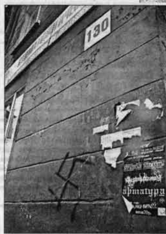
Вид на дом N 130 по пр. Социалистическому с "лицевой" стороны.

Флаги, транспаранты, поздравления украшают город к