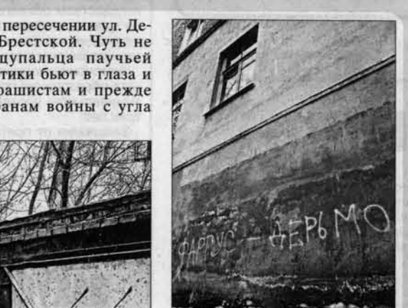
Вид на дом N 130 по пр. Социалистическому со двора.

го района, ЖЭУ... А свастика, фашистские молнии красуются по-прежнему. Рост национализма, угроза фашизма в России - уже реальность, о которой много говорят (и показывают) центральные телеканалы. Но ли это пропаганда? Лидеры питерских скинхедов обещают: дальше будет хуже. Все идет из столицы, и вот уже в нашей глубинке прорастают "черные цветочки" свастики. Оказывается, можно убирать мусор на субботниках, не поднимая глаз на стены и углы домов, "засиженные" душно пахнущими надписями и всяческими объявлениями.