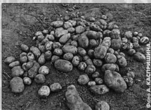
Для яровизации пойдёт и большая, и маленькая. Главное, чтобы не болела.

ко срез более доступен заражению, проще болезни к резаному картофелю прицепятся. Когда мы на станции выращиванием семенной картошки, процесс вегетации при простом проращивании, когда картошка достигает спелой фазы. Ведь чем больше картофель растет, тем более вероятность болезни. А частник выбирает из