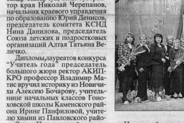
Групповой портрет на память.

Нынешний конкурс отличается молодостью большинства его участников - педагогический стаж у многих всего 3-4 года. Конкурсанты его хоронить. Конкурсы всего 16 лет, и нынче он в первый раз проходит в рамках национального проекта. Вполне возможно, что в связи с этим изменятся какие-то критерии, подходы, и он обновится, вернет себе былую популярность.