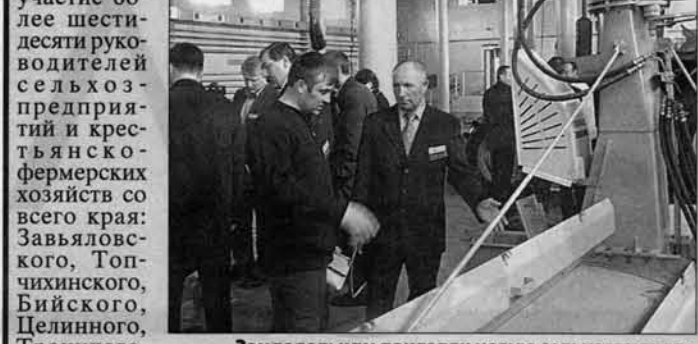
Земледельцам показали новую сельхозтехнику.

Компания «Алтайгротех» провела с сельхозтоваропроизводителями края расширенный семинар-совещание.