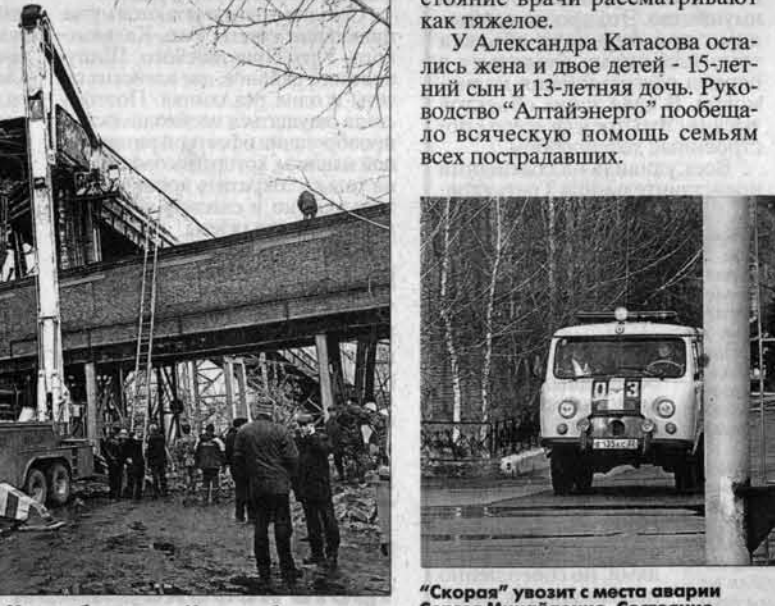
17.45. Место обрушения. Идет разбор завалов.