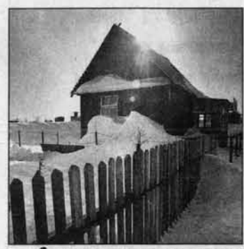
Солнце светит по-весеннему. "Скоро начнем", - мечтательно вздыхает садовод.

Пока есть еще снег, необходимо срочно окучить штамбы и основания скелетных стучей нижнего яруса снегом, и чем выше, тем лучше.