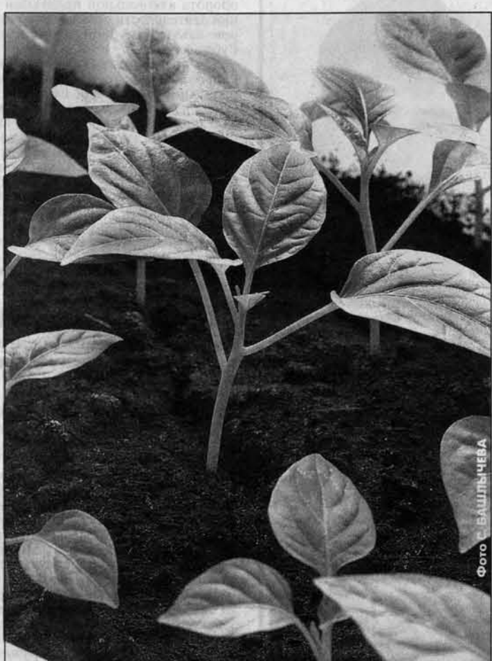
Хорошая рассада выглядит вот так.

можно раньше и перевозят ее на участках пересохшую, вытянувшуюся, хрупкую, и такая долго и трудно приживается.