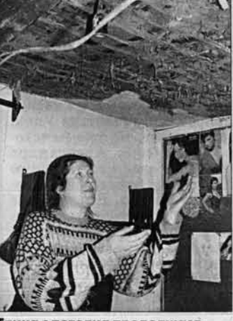
Глина с потолка продолжает осыпаться.