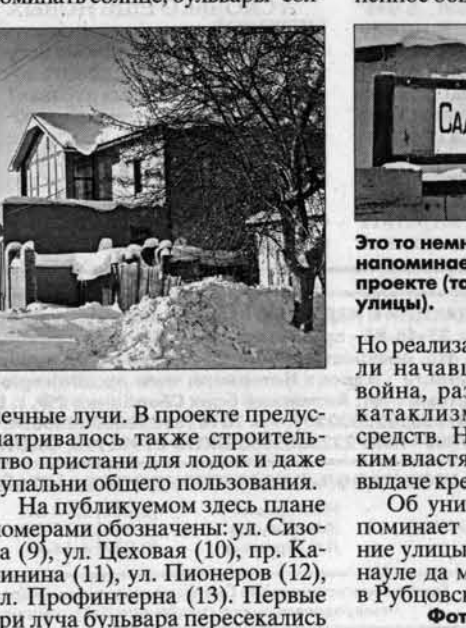
Улицы Садыгородская в Барнауле.