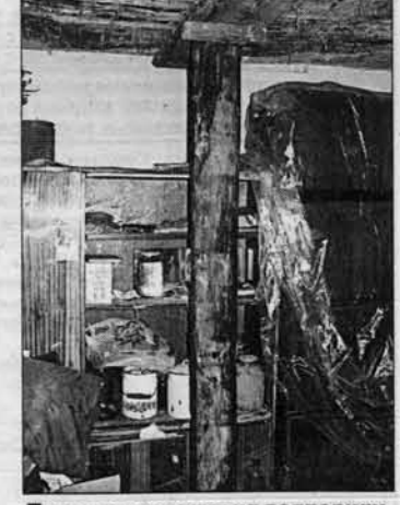
Потолок держится на подпорках.