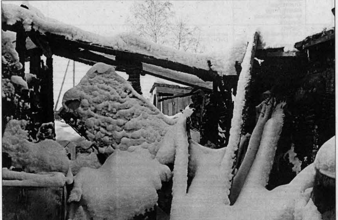
Все пристройки к дому сгорели.

В самые сильные морозы жительница Барнаула с тремя детьми осталась без крова над головой и уже месяц живет на пепелище