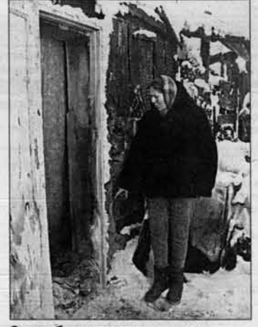
Здесь была входная дверь.