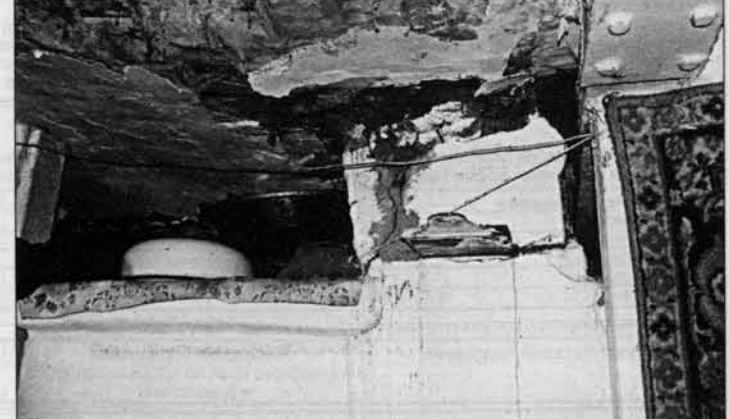
Печная труба осела.