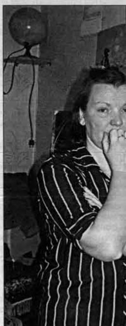
Мама Александра недавно перенесла операцию. Но несчастье с сыном пережить оказалось труднее.

На следующий день ему стало еще хуже. После полудня 27 января об этом случае стало известно начальнику медсанчасти службы 41-й армии Есаулову. Тот позвонил в краевой центр медицины катастроф и попросил переправить солдата в Новосибирск. Медики центра выехали в Алейск на реанимацию, перевезли в Барнаулский аэропорт и верто-