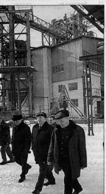
Современное крестьянское хозяйство "Роса", география поставок - от Москвы до Находки.

Строительство физкультурно-спортивного комплекса и противотуберкулезного диспансера в Рубцовске идет при прямой поддержке депутата Госдумы Николая Герасименко.