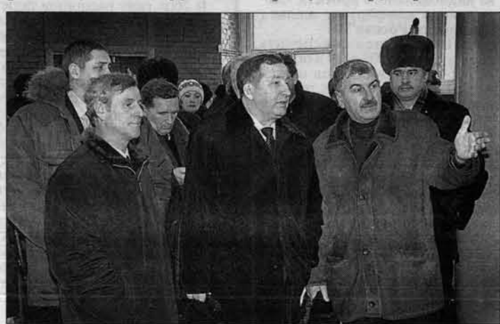
Мэр Рубцовска Артур Дерфлер, губернатор края Александр Карлин и генеральный директор "Алттрака" Вячеслав Колосов на выставке сельхозтехники.

7-8 февраля глава администрации края Александр Карлин провел в рабочей поездке по Рубцовску, Рубцовскому и Шипуновскому районам