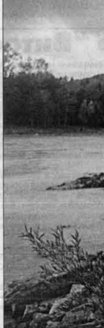
В экспедиции. Река Катунь.