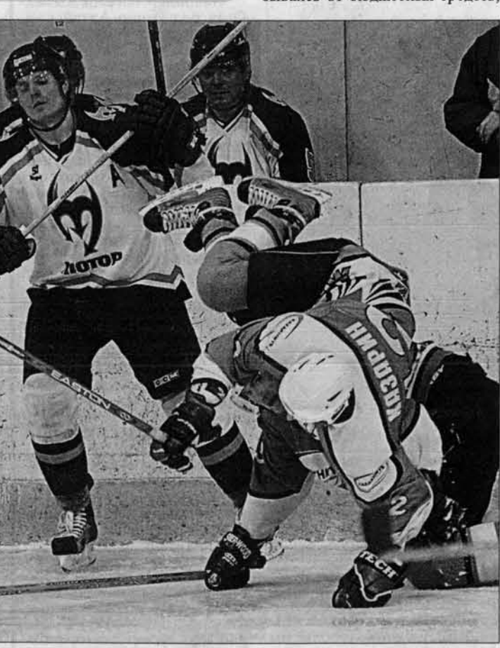
Хоккей - игра не для хлюпиков.

- Перед отъездом хоккеистов на матчи в Челябинск и Орск я долго беседовал с лидерами команды. Скажу так, 60-70 процентов основного состава изъявили желание продолжить карьеру в нашем клубе на тех же условиях, какие они имеют сейчас.