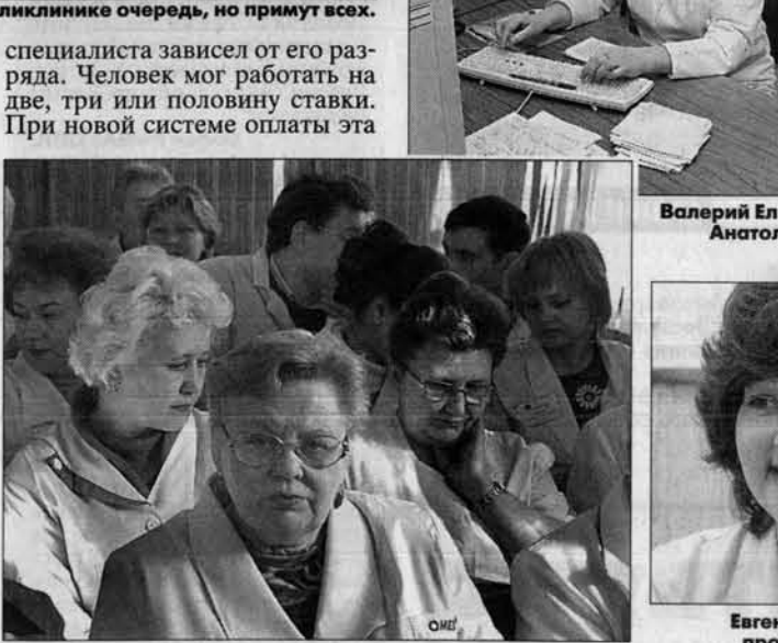
У врачебного коллектива вся большая работа - впереди.

привязка не имеет значения. В федеральный регистр вошли только те врачи, которые работают на одну ставку. Они и получают новую зарплату. У кого нагрузка меньше, не включены в список, а работающие более чем на ставку будут получать за одну.