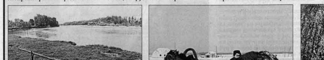
На берегу Чарыша.

В 1797 ГОДУ БЫЛ ПРЕДСТАВЛЕН ПРОЕКТ ОБЪЕДИНЕНИЯ ПУТИ ИЗ БАРНАУЛА В СИБИРСКИЕ РЕКИ ПОСРЕДСТВОМ КА-