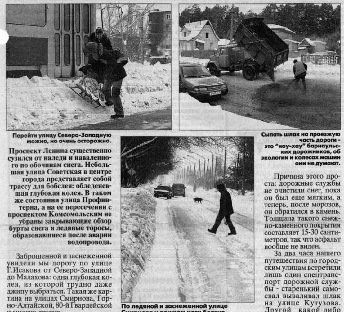
Перейти улицу Северо-Западную можно, но очень осторожно. Проспект Ленина существенно сузился от навали и навального по обочинам снега. Небольшая улица Советская в центре города представляет собой трассу для любителей обледеневшей глубокой колеи. В таком же состоянии улица Профинтерна, а на ее пересечении с проспектом Комсомольским не убранны закрывающие обзор бугры снега и ледяные торосы, образовавшиеся после аварии водопровода. Зброшенной и заснеженной увидели мы дорогу по улице Г.Исакова от Северо-Западной до Малахова: одна глубокая колея, из которой трудно даже джипу выбраться. Такая же картина на улицах Смирнова, Горно-Алтайской, 80-й Гвардейской и многих других.