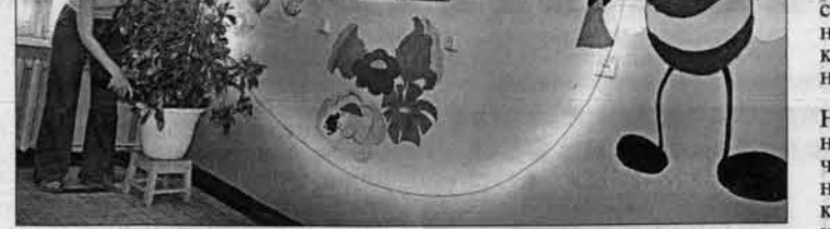
В комнате студентов.

Сравнила с нашей школой, в которой работаю. Как трудно нам дается ежегодный ремонт, как также приводить коридоры и кабинеты в надлежащий вид. А о капитальном ремонте можно только мечтать. В школе-доме дети проводят большую часть светового дня.