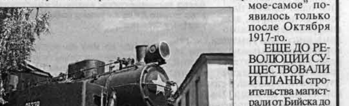
Паровоз на платформе у локомотивного депо ст. Барнаул.

Сумм от строительства, кроме рекордных сроков стройки, являлись и сведения о том, что на стройке работали несколько автомобилей и два мощных экскаватора на железнодорожном ходу, производивших разработку Гляденской выемки (в районе железнодорожного моста) - ведь нам столько лет твердили, что все “самое-самое” появилось только после Октября 1917-го.