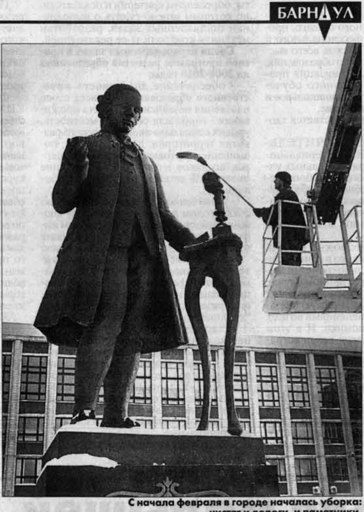
С начала февраля в городе началась уборка: чистят и дороги, и памятники.

Причина этого проста: дорожные службы не очистили снег, пока он был еще мягким, а теперь, после морозов, он обратился в камень. Толщина такого снежно-каменного покрытия составляет 15-30 сантиметров, так что асфальт вообще не виден. За два часа нашего путешествия по городским улицам встретили лишь один спецтранспорт дорожных служб - старенький самосвал вываливал шлак на улице Кутузова. Другой какой-либо специальной снегоуборочной техники на улицах Барнаула увидеть не пришлось. Не удалось также узнать, почему у дорожников исчезла песчано-солевая смесь, которой надлежит посыпать проезжую часть на перекрестках и перед светофорами. В этих местах нынче зеркально отполированный лед, как и на останках общественного транспорта. Особенно опасная ситуация на трамвайной остановке "Новый рынок": изза неубранного обледеневшего снега можно легко скатиться под пролетающий трамвай. Только в январе этого года в адрес должностных лиц дорожных организаций Барнаула