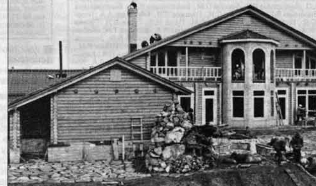
Эту баню привезли в Казахстан с Алтая.