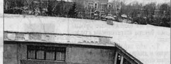
Эту надпись под окнами колледжа студенты выпотрожили дружно и весело.

курс у нас на "Лечебное дело", но и на другие специальности. Недобор нет. Кстати, во многом подобная ситуация объясняется тем, что администрация колледжа не ждет милости от природы, а ведет активную профориентационную работу. На базе трех школ: 80-й, 52-й и 37-й созданы медицинские профильные классы. ...На дне рождения колледжа было много поздравляющих, но мы тоже хотим присоединиться к их числу. Будьте здоровы!