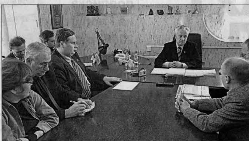
Во время встречи в редакции.

«Более десяти лет продолжался развал агропромышленного комплекса. Помочь сельчанам предполагается в основном с помощью лизинга техни-