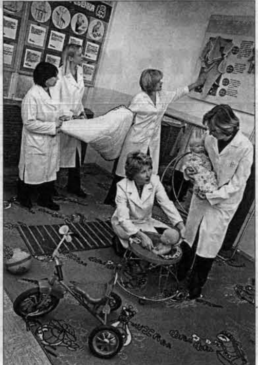
Комната здорового ребенка - здесь учат, чем кормить детей, как с ними играть...