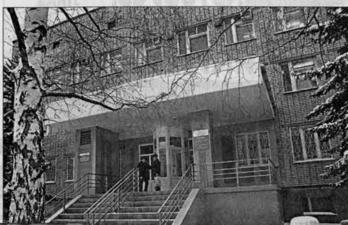
Краевая стоматологическая поликлиника - одна из лучших в Сибирском регионе.

лиш, которые выезжали в самые отдаленные уголки края, где врачей не хватало, а выехать в город селянам было не так то просто. Продолжительность таких командировок до-