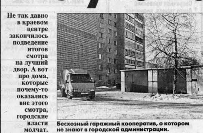
Безхозный гаражный кооператив, о котором не знают в городской администрации.

Жители дома забыли тревогу, стали обращаться в районную администрацию, потом в городскую. В телефонных разговорах их заверили, что обязательно с самовольщиками разберутся и гаражи снесут. Однако со временем жители поняли, что никто из работников администрации этим вопросом не занимался. Тем временем на гаражи повесили двери, а рядом с двумя гаражами появились третий, уже со свежевыкрашенными дверями. Кто так заболит опекать нелегальных застройщиков, жители дома так и не смогли уста-