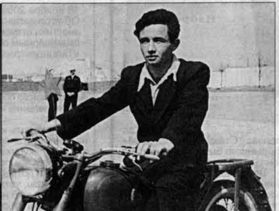
Курс - на "Санниковский". 60-е годы прошлого века.

Р.С. Позавчера глава администрации края А.Карлин тепло поздравил юбиляра, вручил ему благодарственное письмо за большой вклад в развитие краевого аграрного производства.