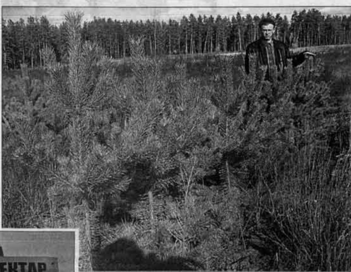
Строй молодых сосенок на "путинском" гектаре. В 2001 году они были всего 12 сантиметров.