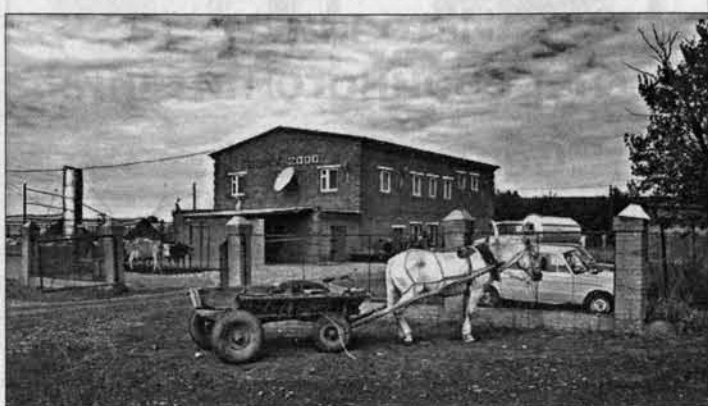
Преступник несколько часов ждал, пока от скотоубойного пункта разедутся люди.

В ночь с 24 на 25 августа в селе Карпово Красноярсковского района трагически погибли три человека. Преступник был задержан через несколько дней - 1 сентября. Он почти сразу сознался в совершенном, но следствие продолжается. Ведь это преступление оказалось не первым для него. Не умолкая до сих пор в районе слухи и пересуды. В интересах следствия мы не можем назвать имя и фамилию человека, задержанного по обвинению в тройном убийстве, но можем рассказать, как это было.