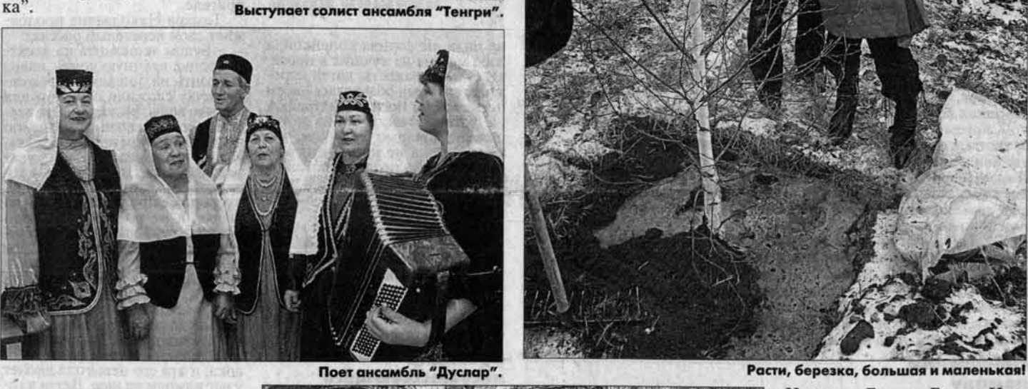
Выступает солист ансамбля "Тенгри". Поет ансамбль "Дуслар".

Концерт по поводу В ДК "Сибнефтегаза" накануне Дня народного единства состоялся концерт коллективов ассоциации этнокультурных объединений Алтая. В нем приняли участие вокально-хореографическое ансамбль "Юность", ансамбль "Дуслар" (центр татарской культуры "Дулкын"), солисты "Союза армян Алтайского края", Российско-немецкого дома, центров казахской и башкирской культур и ансамбль танца "Лариса", "Калинка".