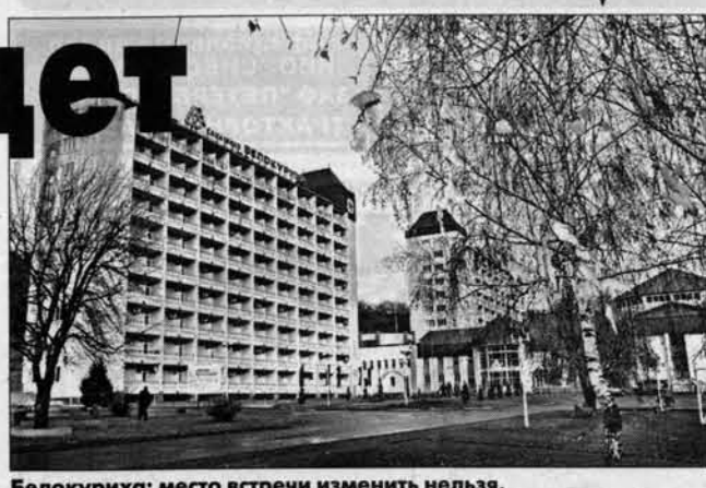
Белокуриха: место встречи изменить нельзя.

В Белокурихе прошло совместное совещание руководителей органов исполнительной власти приграничных территорий