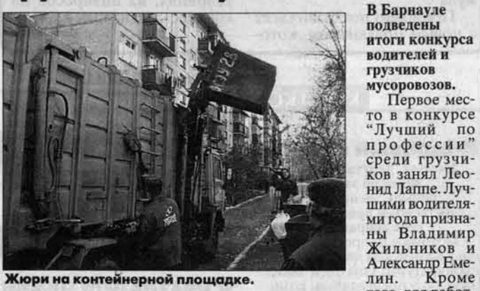
Жюри на контейнерной площадке.

В Барнауле подведены итоги конкурса водителей и грузчиков мусоровозов.