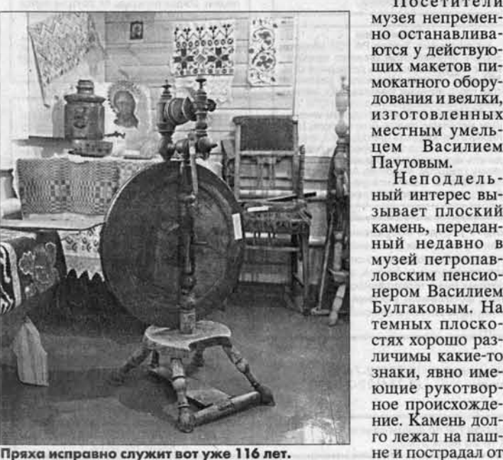
Праха исправно служит вот уже 116 лет.