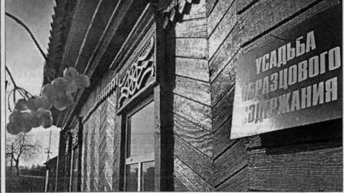
Домик художника - как игрушка. Калину оставили для птиц и, конечно, для красоты.

- Судьба такая? - Вот-вот, судьба, иначе и не скажешь. Мы, Мальковы, из