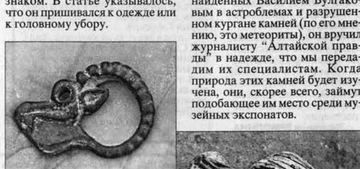
Бронзовая голова козла, возможно, украшала ханскую одежду.