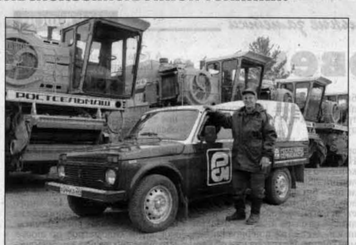
Ремонтно-диагностические автомобили оснащены современным итальянским оборудованием.

На селе говорят: как подготовишься к жатве, так ее и проведешь. Имеется в виду в первую очередь готовность к уборочной кампании парка сельхозмашин, их техническое состояние. Поломки и долговременный простой могут сорвать график сельхозработ и в конце концов оставить хозяйства без урожая. Такое было не раз. Но только не с хозяйствами, которые работают у «Алтайагроснаб». Три года назад на его базе был создан технический центр, который взял на себя все проблемы, связанные с гарантийным и сервисным обслуживанием, ремонтом и подготовкой сельхозмашин к работе в поле. Благодаря оперативности ремонта и высокому уровню сервисного обслуживания техцентра многие сельхозпредприятия края в нынешнюю страду успели убрать хлеба в запланированные сроки.