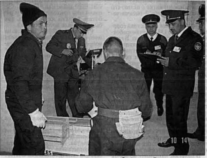
Совместный досмотр грузов.

ты заинтересовались: есть ли в нем место для работы и наших пограничников. Коллега заверил его, что есть, и даже показал где. Оба они не раз подчеркнули, что эффективность всех таможенных нововведений во многом зависит от взаимодействия с пограничными службами. Важность продолжения начатого эксперимента подчеркнул в интервью журналистам и генеральный секретарь Евразийского экономического сообщества Григорий Рапота. Он отметил, что любой хороший опыт в ЕЭС старается распространять на все пять государств, входящих в него. Очень важно для них, чтобы грузы и товары от Душанбе до Москвы проходили быстро и беспрепятственно. "Вопрос о создании таких "зеленых коридоров" мы обсудим и на совете руководителей пограничных служб", - пообещал он. Александр Жерихов к этому добавил, что мы - пионеры такого пункта на постсоветском пространстве и должны сделать все, чтобы эксперимент удался. Ведь мы хотим, чтобы к нам в этом плане подключились и Евросоюз, и Китай, и Турция. Так что цена вопроса очень велика.