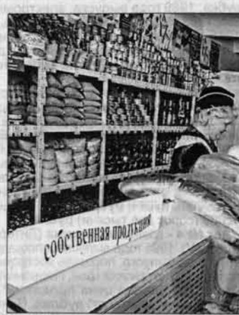
Кооперативный магазин в с. Моховское.

рабатывающее производство. Там, где руководители тщательно следят за рынком сбыта и используют каждую возможность занять свободную нишу. Это не трудно поднять цену и закупить тонны мяса. Главный вопрос: куда его потом деть? Над отлаженным производством. Там, где руководители тщательно следят за рынком сбыта и используют каждую возможность занять свободную нишу. Это не трудно поднять цену и закупить тонны мяса. Главный вопрос: куда его потом деть? Над отлаженным производством.