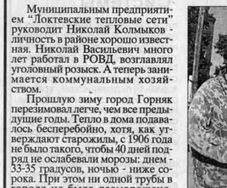
На мемориале Славы.

Но учебной всю молодежь и подростков не охватить. Нужно было помочь организовать их досуг, чтобы они не бродили бесцельно по улицам. Вернули к жизни брошенные мемориалы Победы, 60-летия Победы добровольные пожертвования, помогли предприятиям и предпринимателям, общими усилиями собрали 200 тысяч рублей. Мемориал теперь как новый.