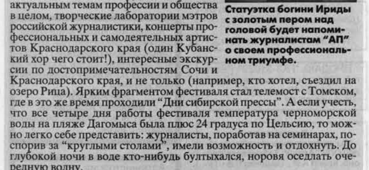
Статушка богини Ириды с золотым пером над головой будет напоминать журналистам "АП" о своем профессиональном триумфе.

X фестиваль Союза журналистов России сначала предполагал проводить в Ставрополе, в городе Кисловодске. Но руководство Ставропольского края, видимо, решило, что не сможет принять на должном уровне несколько тысяч журналистов со всей России, и тогда свои услуги снова предложили руководители города Сочи и санаторно-курортного комплекса "Дагомыс". Чему журналисты, особенно из сибирской глубинки, скорее обрадовались, так как большинство не собиралось ограничиваться минеральной водой кисловодского розлива. Фестивальная программа, как всегда, была насыщенной. "Круглые столы" по актуальным темам профессии и общества в целом, творческие лаборатории мэтров российской журналистики, концерты профессиональных и самодеятельных артистов Краснодарского края (одни Кубанский хор чего стоит!), интересные экскурсии по достопримечательностям Сочи и Краснодарского края, и не только (например, кто хотел, съездили на озеро Рица). Ярким фрагментом фестиваля стал телемост с Томском, где в это же время проходили "Дни сибирской прессы". А если учесть, что все четыре дня работы фестиваля температура черноморской воды на пляже Дагомыса была плюс 24 градуса по Цельсию, то можно себе представить: журналисты, поработав на семинарах, посприпор за "круглыми столами", имели возможность и отдохнуть. До глубокой ночи в воде кто-нибудь булькал, норovia оседлать очерединую волну.