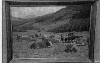
"Осень в предгорьях Алтая" художник написал с натуры!

Пятидесятые и начало шестидесятых годов отмечены интересом художника к целинной теме. Он неоднократно выезжал с творческими группами в сельские районы, и в результате этих поездок родились целые серии портретов и жанровых композиций, а в пейзажах нашел отражение степной Алтай. В 1961 году художник впервые побывал в Горном Алтае, и это стало поворотной точкой его творческой судьбы. Именно здесь, среди горных вершин, чабанских стоек,