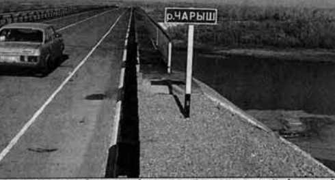
Новый мост (вверху), старый pontонный (внизу). Почувствуйте разницу.