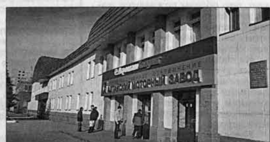
Та заводская проходная...