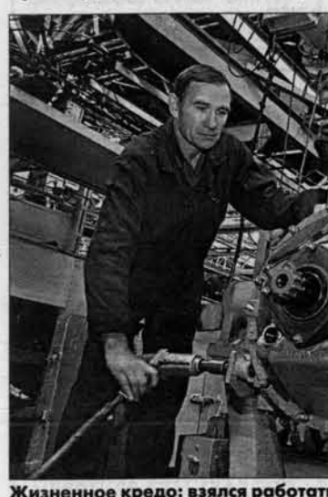
Жизненное кредо: взялся работать, так работай.

тевке... Принято тогда так было. - Чего в этом было больше: попортили или заставили? - Попросили. Свободно мог бы остаться в своем механическом и так бы, наверное, до сих пор там и работал. Но заводу надо было или со стороны людей набирать, или свои внутренние резервы использовать. Вот я таким резервом и оказался. - Это вы сейчас мастер, а тогда как было: пришел на стеновую сборку 20-летний парень и ну давай двигатели собирать? - Почти так и было, хотя, честно признаться, двигателя я тогда совсем не знал, просто ни разу не видел. Но времена были