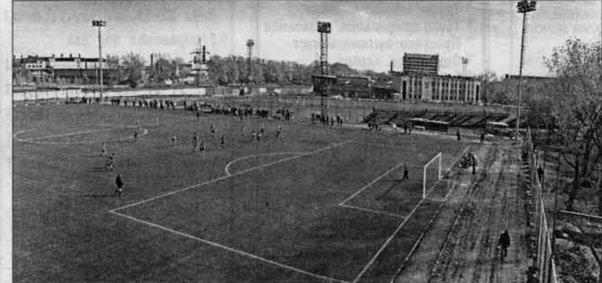
Так выглядит преобразованный спорткомплекс "Трансмаш".

выскачь на поле и самому опробовать чудо-газон. Пацаны, давайте в пас поиграем, - обув ботсы, попросил я мальчишек в желтой форме, разминавшихся на поле.