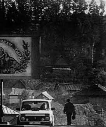
Оценку поставит зима

объемов не было даже в советские времена. Сейчас на местном льнозаводе завершается монтаж новой линии по переработке льна. Конечно, это оборудование уже поработало во Франции, где государство активно помогает льноводам дотациями. Но теперь эта линия послужит на благо местной экономики.