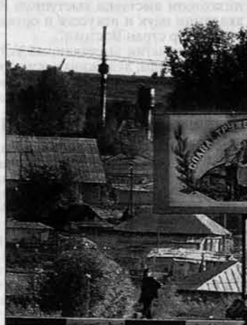
В Залесовском райцентре.

объемов не было даже в советские времена. Сейчас на местном льнозаводе завершается монтаж новой линии по переработке льна. Конечно, это оборудование уже поработало во Франции, где государство активно помогает льноводам дотациями. Но теперь эта линия послужит на благо местной экономики.