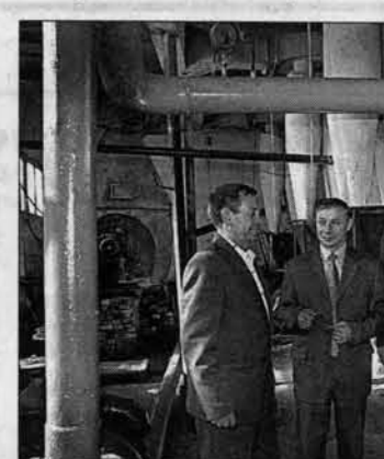
Готовность котельных к отопительному сезону заглавы администрации - одна из главных забот.

Удалось отремонтировать котельные. Большие средства были вложены в подготовку внутренних тепловых сетей. Это позволит не нарушать температурный режим в школе, библиотеке, Доме детского творчества и других объектах социальной сферы. Другое дело, что такое напряженное финансовое состояние привело к определенным задержкам в