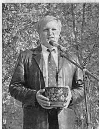
Братина в руках у коммерческого директора Волчихинского пивоваренного завода