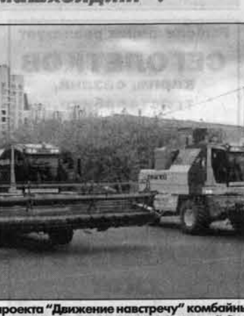
Барнауле, площадь Сахарова. Главные герои проекта "Движение навстречу" комбайны "Енисей-959" перед постановочным "танцем". Это было красиво!

Этот проект стартовал 12 августа в селе Карамышево Змеиногорского района (см. "АП", № 241 от 20.08.2005 г.). Тогда на полях близ села приступили к уборке хлеба 15 новых зерноуборочных комбайнов "Енисей-959", которые ОАО "Агроماشхолдинг" поставило в хозяйство "Мельник", причем рассчитаться сельчане должны были не деньгами, а частью зерна нового урожая.