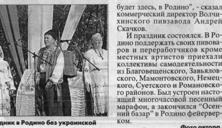
Какой же праздник в Родино без украинской песни!

И праздник состоялся. В Родино поддержать своих пивоваров и переработчиков кроме местных артистов приехали коллективы самодеятельности из Благовещенского, Завьяловского, Мамонтовского, Немецкого, Суевского и Романовского районов.