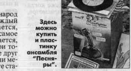
Цены - сходные, книжки - годные!