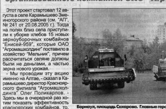
Барнауле, площадь Сахарова. Главные герои проекта "Движение навстречу" комбайны "Енисей-959" перед постановочным "танцем". Это было красиво!

4 октября в Барнауле прошло торжественное закрытие проекта "Движение навстречу"