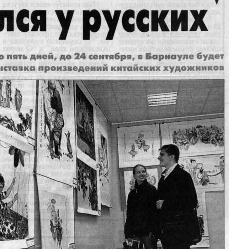
Китайская живопись радует барнаульцев.

На выставке представлено и другое направление современного китайского искусства - масляная живопись. Двадцать пять крупных живописных полотен разместились в павильоне "Открытое небо" в ГМИИ. Разные по стилю и манере письма, они поражают высоким профессионализмом исполнения, сложными сюжетами и разнообразием тем.