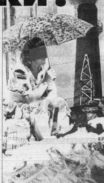
Жеңгірлер, - сожелет Косачев, окончательное утверждая во мне мысль, что наказ об экономическом ликбезе звучит как читабельный приказ.

Хватит искать виноватого, пора от эмоций перейти к делам. Эмоция зрявая, но не нашлось ей применения за прошедшие семь лет. Мы продолжали рыдать над развалинами, по старинке надеясь на помощь сверху, на "манну небесную" от правительства. Нынешнее плачевное состояние экономики края - это плод медлительности в определенных ее приоритетности модернизации производства, нежелание понять и осмыслить жесткие реалии нового времени и новой экономики.