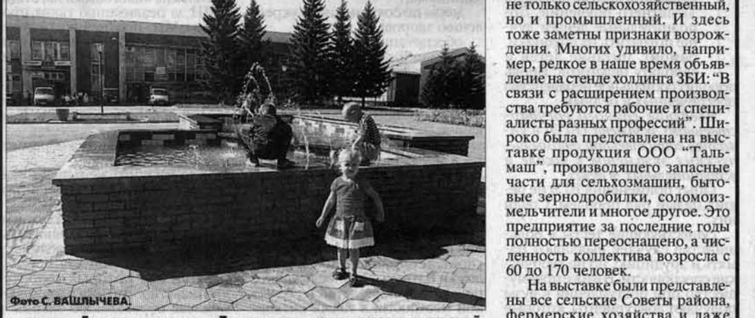
Главная площадь в Тальменке - место народных гуляний.

А на эти именины, как назвали сами тальменцы состоявшийся в минувшие выходные День района, испечен караван. Да не один, а много, чтоб хватало на всех. Это уже расстарались коллектив хлебопека и пекарни-предприниматели. Угощать хлебом-солью было кого - гостей, как говорится, со всех волостей сошлось и съехалось много.