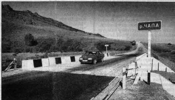
В добрый путь по новому мосту!

метр асфальтобетона приносит до двух миллионов рублей прибыли в год. Это ускорение движения автотранспорта, экономия топлива, рабочие места, причем не только в дорожной отрасли. Дороги в горах - это жизнь".