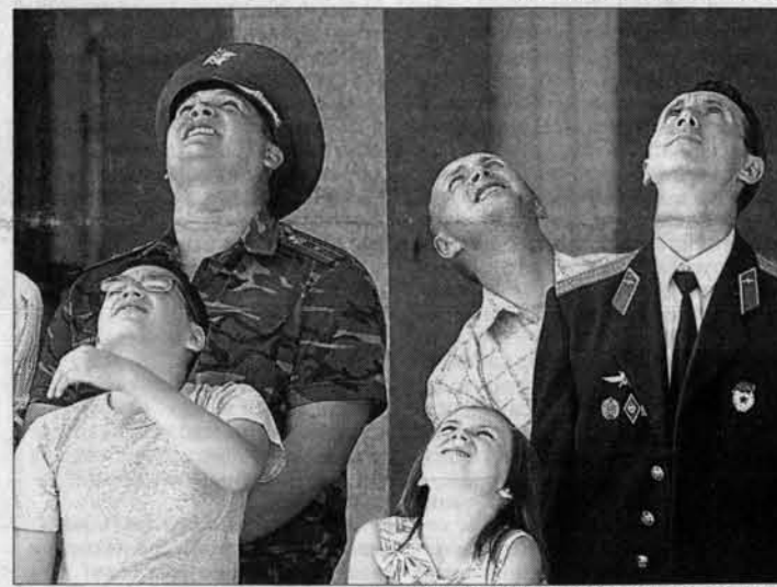
...а восхищенные зрители на земле.