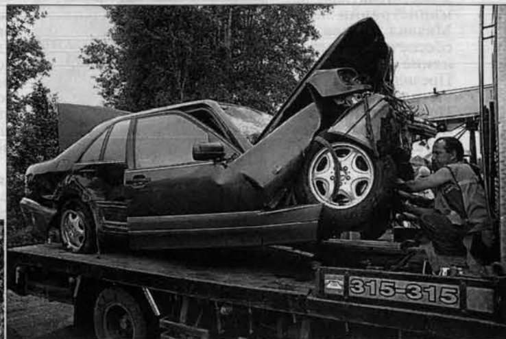
Моторный отсек "Мерседеса" от удара загнуло.