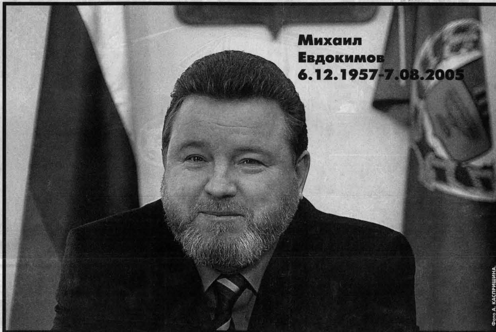
Михаил Евдокимов 6.12.1957-7.08.2005

Сессия состоится 11 августа 2005 года в большом зале заседаний администрации края. Начало заседания в 11 часов, обсуждение вопроса во фракциях и депутатских группах - в 10 часов.