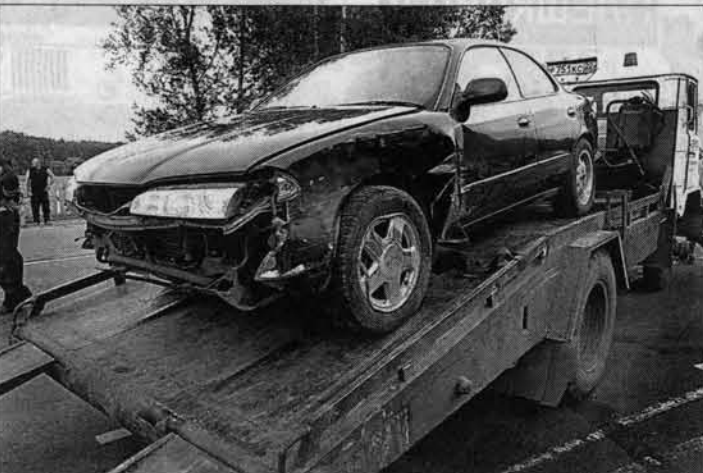
Это та самая "Тойота", которую пытался обогнать "Мерседес".

заискрилась и вспыхнула. Пожарные залили место аварии пенной.