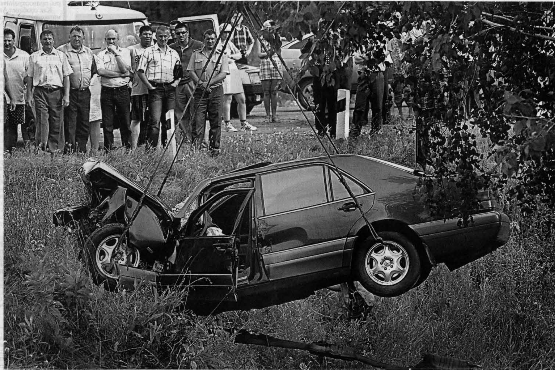
Восьмицилиндровый "Мерседес" губернатора развивал скорость до 250 километров в час.