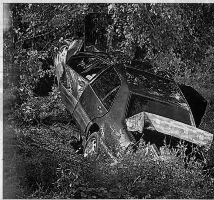
"Мерседес" пролетел около двадцати метров.