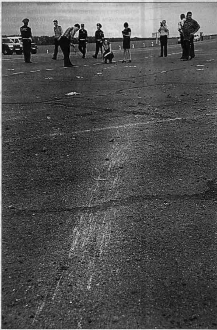
Тормозной путь "Мерседеса" составил более 50 метров. Но тяжелая машина не смогла остановиться...