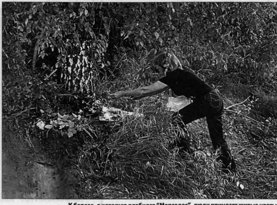
К березе, о которую разбился "Мерседес", люди приносят живые цветы.