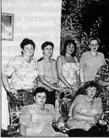
У этих женщин за плечами - не одна командировка в Чечню.

непробились российские войска, врачи госпитали, куда были доставлены прооперированные раненые, были поражены высоким качеством операций.