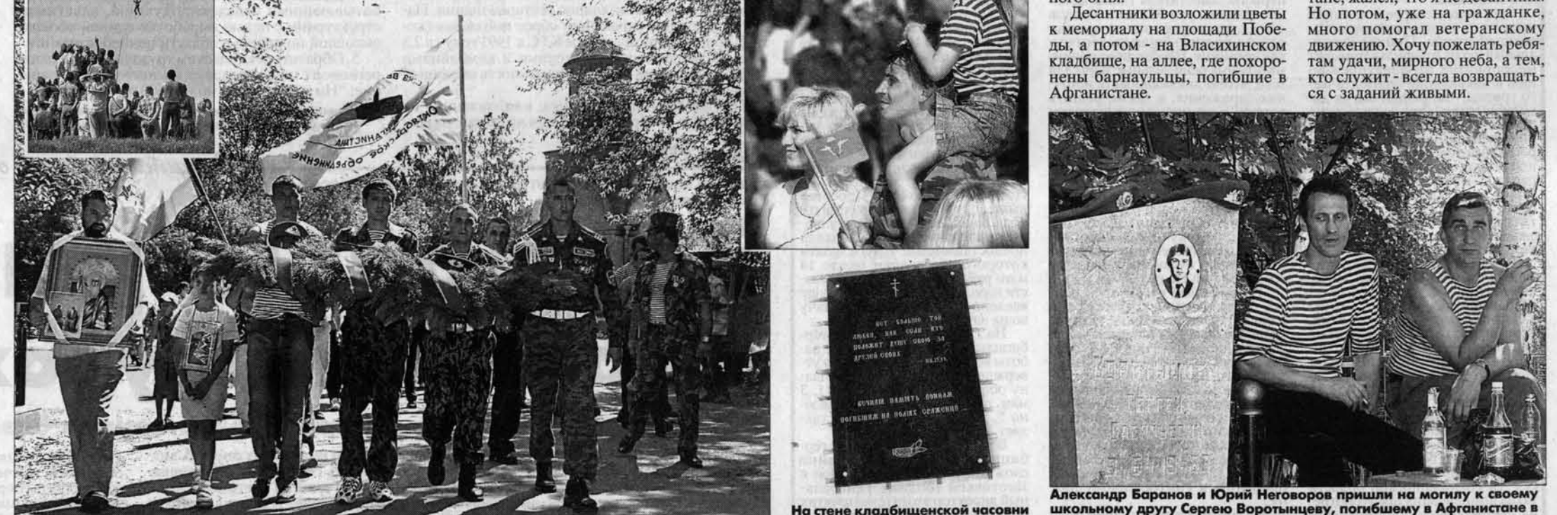
Икона Ильи-пророка, в чей день празднуется день ВДВ, сопровождала вчера все мероприятия праздника. Илья-пророк - покровитель воинов, которые сражаются за правое дело.

Только в Барнауле более двух тысяч ветеранов ВДВ. Многие из них участвовали в боях в Афганистане, в Чечне, в Абхазии, служили в Югославии. На площадь парни в голубых беретах и тельняшках пришли с медалями и орденами. Многие - вместе с семьями, чтобы сыновья и дочери знали, в каких войсках служили их отцы.