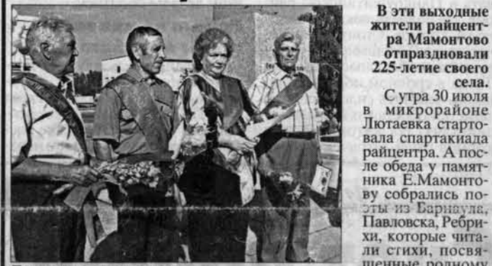
Почетные граждане села.