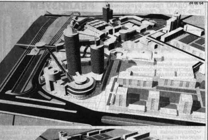
Победивший проект: так со временем может выглядеть район Нового рынка.

Подведены итоги открытого конкурса архитекторов "Концепция застройки территории в границах пр. Ленина, ул. Пионеров, пр. Калинина и полосы отвода железной дороги в Барнауле".