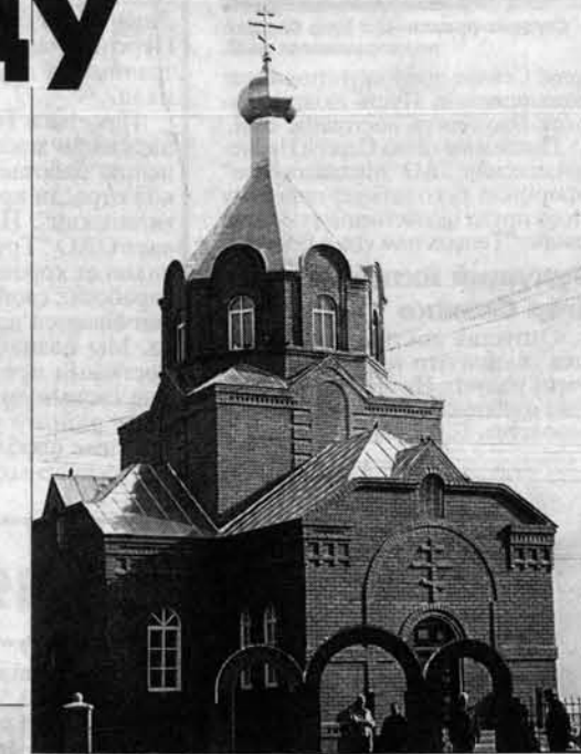
Храм Святой Троицы виден в Шипуново с любой точки.

Церковь построена на средства благотворительного фонда Духовного возрождения и социальной поддержки, который учрежден Быковским совхозом, Шипуновским элеватором и Шипуновским райотсблком, строительной организацией "Гранит". На деньги фонда арендовали землю, поля и с прибыли за урожай начали строительство. Сейчас на средства этого же