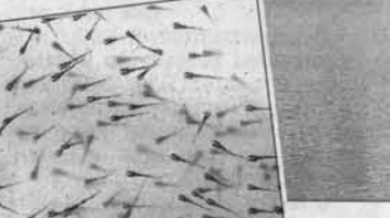
На этом пруду разрешена рыбалка.

тановлена краевая компенсация на рыбобосалочный материал. Крайсельхозуправление откликнулось на его, домашневского, просьбу проинспектировать в крае для начала те пятьдесят хозяйств, что занимались прежде прудовым рыбководством. Реальнее всего именно они могут первыми взяться вновь за эту отрасль.