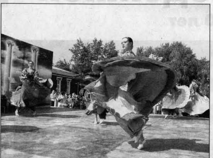
В вихре танца.