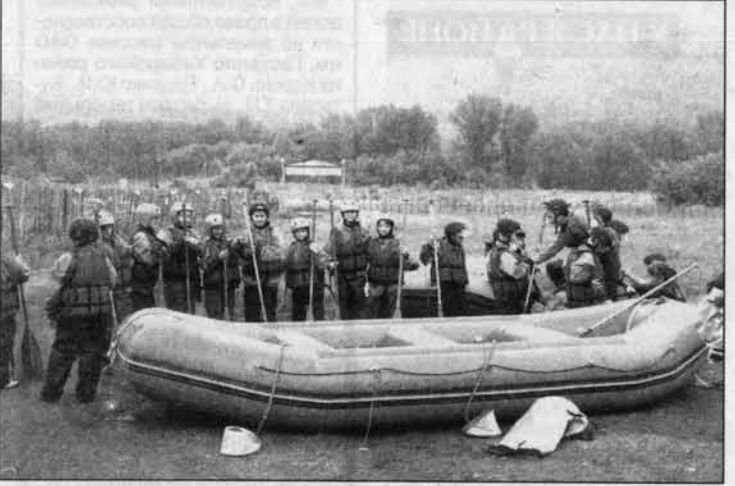
Команда рафтеров к сплаву готова. Юные сплавщики показали себя настоящими спортсменами-водниками.

- В таких семьях очень сильное психологическое напряжение. Когда отец уезжает в командировку в Чечню, все внимание матери и других близких родственников приковано к телефону: вдруг позвонят и скажут, что с мужем что-то случилось. Жить в постоянном ожидании, бороться с собой и говорить, что все будет хорошо - непросто. И дети все это чувствуют. Поэтому и воспитатель, и вожатые пытались создать теплую атмосферу. И уже к концу заезда ребята стали без стеснения общаться друг с другом и с вожатыми.