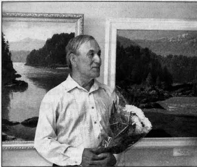
"Сегодня, во времена засилья чернухи и в жизни, и в искусстве..."