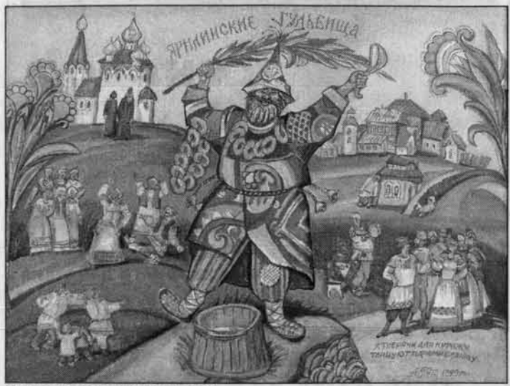
И чего не жились на земле-то?..

Смотришь на работы Потапова и не поймешь, то ли шутит художник, то ли всерьез философствует, то ли просто забавляется от нечего делать.