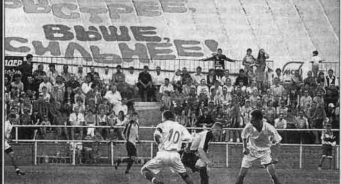
Больше всего зрителей собирал футбол.

На уютном городском стадионе Алейск в минувшее воскресенье финишировал II летняя олимпиада малых городов Алтай.