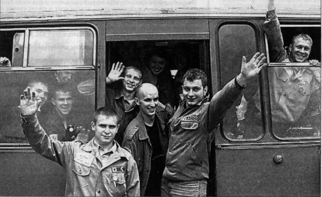
Всего в ССО "Алтай" - более двух тысяч бойцов. На вопрос, зачем они едут в ССО, студенты отвечают: "Это общение, удовольствие, новые знакомства и, конечно, возможность заработать".

27 июня для двух тысяч студентов началось строительное лето