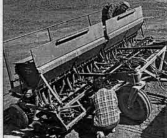
Сегодня техники хватает.

нас крестьянские хозяйства вышли из "Надежды", обрели самостоятельность. Ни одного из них, кроме моего, в настоящее время не существует.