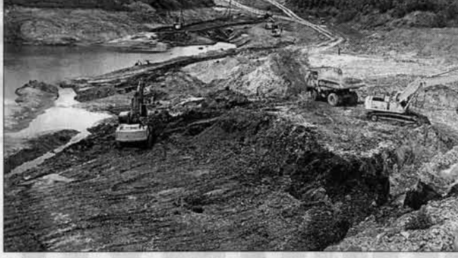
Для Солтона, который находится в стороне от дорог и не имеет ни одного даже среднего размера предприятия, такие слова не будут преувеличением. Рабочие места, налоги и такую экономику понимает каждый житель района.

"Спасение Солтонского района" - так могут назвать Мунайский разрез жители района