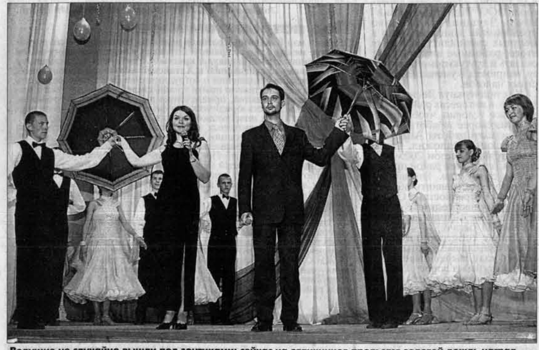
Ведущие не случайно вышли под зонтиками: сейчас на отличников прольется золотой дождь наград.

Впервые для лучших выпускников профучилищ и лицеев края был устроен большой праздник